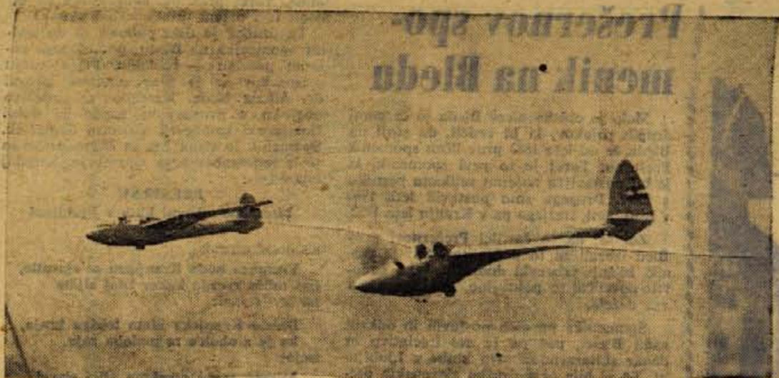
Visoko med oblaki...