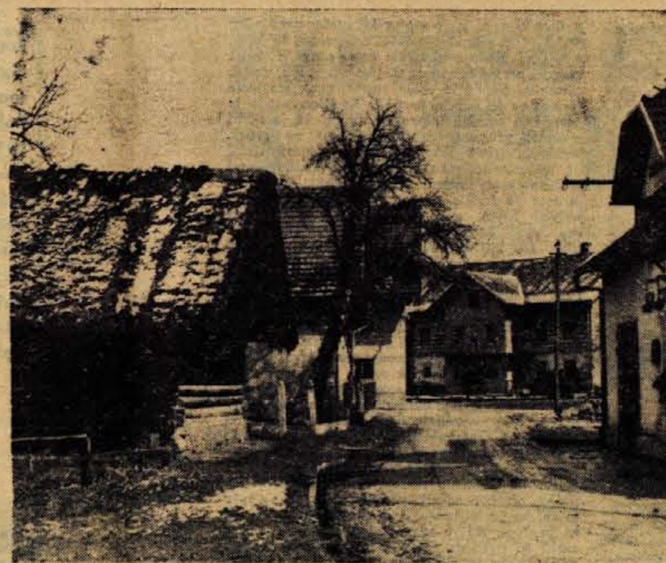
Na sliki levo je najstarejša — lesena hiša v Vogljah — Foto: F. Perdan

Vogljje so bile nekdanj izrazita kmetijska vas, danes