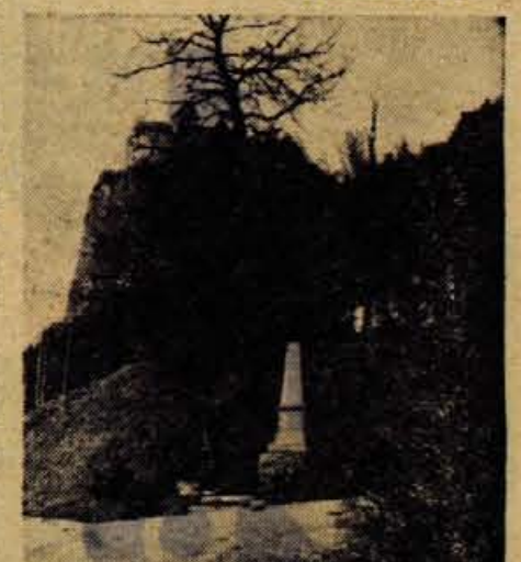
Prešernov obisk na Bledu