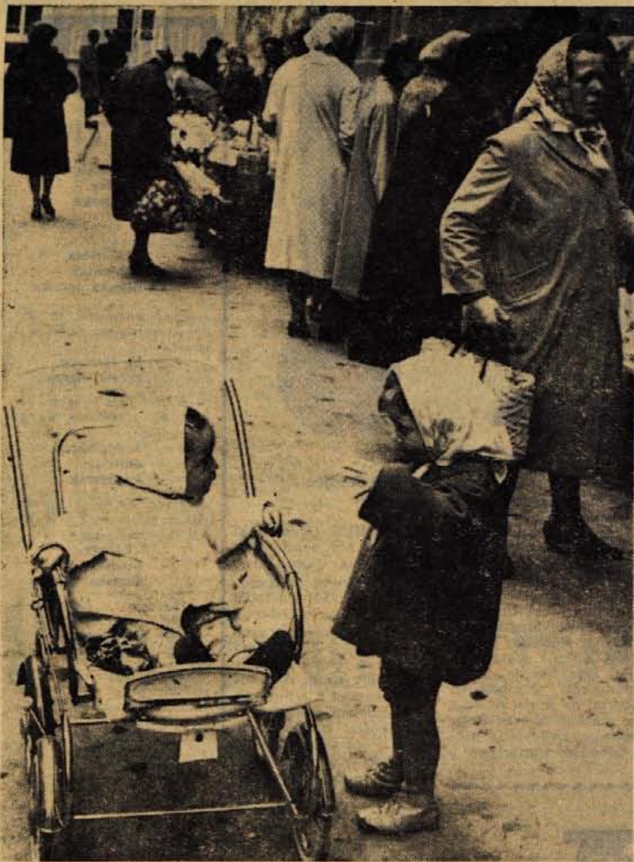
VELIKO ZANIMIVEGA SI IMATA POVEDATI