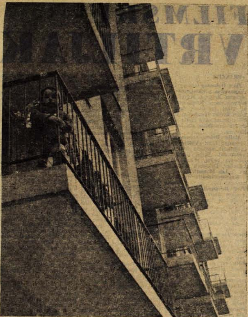
Na balkonu ni tako lepo kot spodaj na trati