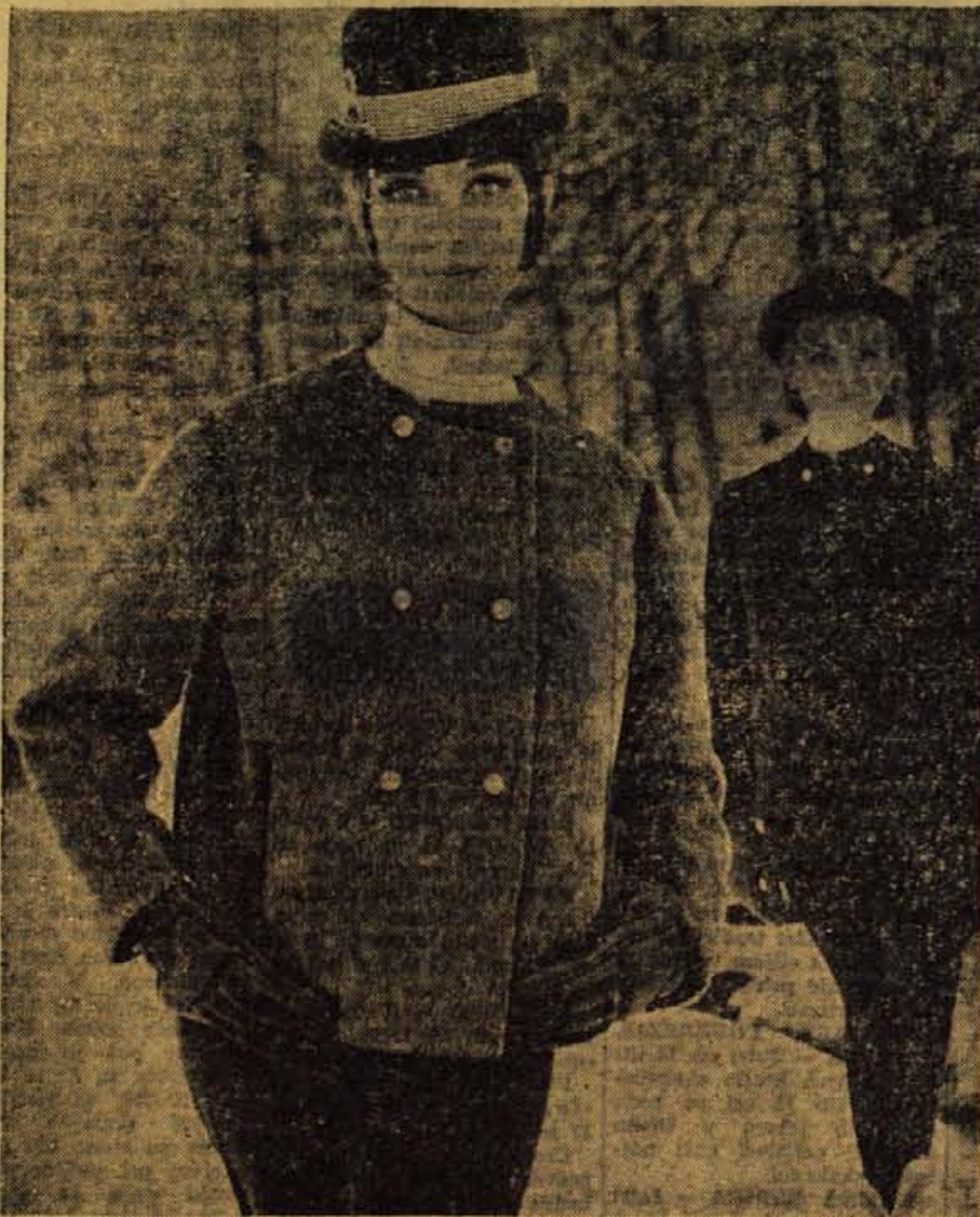
Preprost športni kostim vam bo prišel prav v mnogih priložnostih