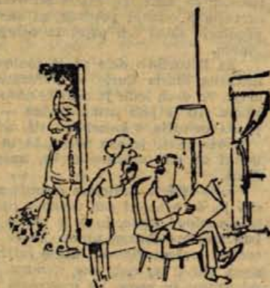
— Zdaj je edinstvena priložnost, da lahko poročiva hčerke. Gospod prosi za roko najinih petih hčera!

RIBI (20. 2.—20. 3.) — Zagotoviš si simpatije širšega kroga ljudi. Tvojih pobud ne jemljemo preveč resno, sčasoma uspeš. Smotno obračaj denar in izrabi prosti čas. Ravnesje med čustvi in razumom bo ugodno vplivalo. Zagovarjaš prijatelja.