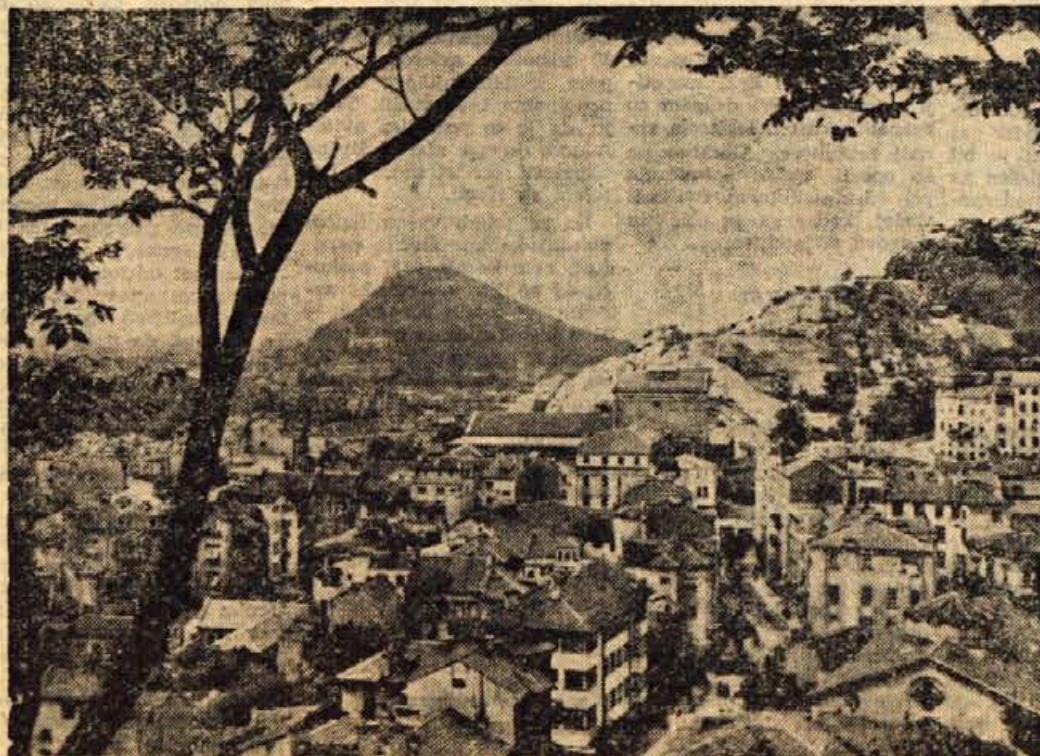
Panorama Plovdiva. Posnetek je narejen iz znane »Sahat-tepe«