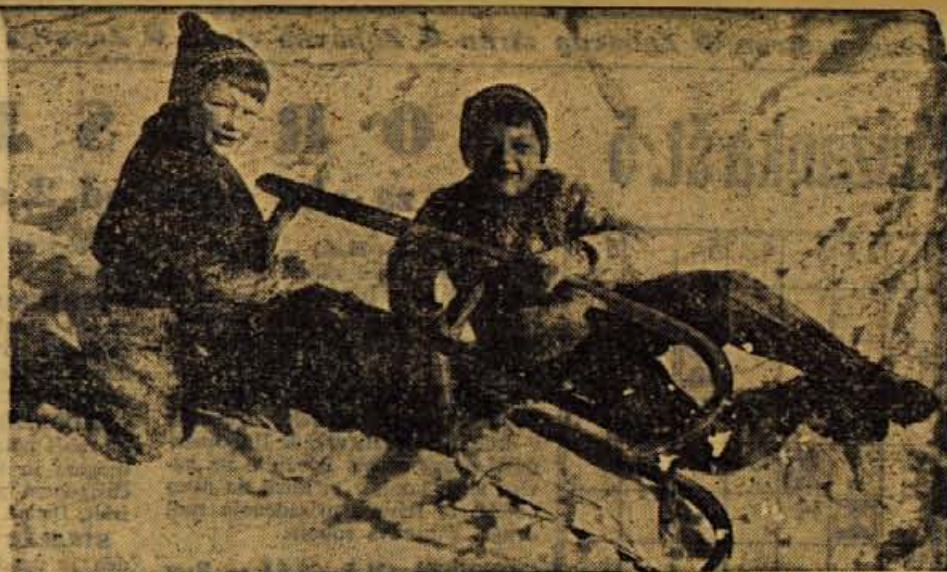
Zdaj, ko so počitnice na vseh šolah podaljšane še za en teden, tudi ta dva na sliki nista izgubila upanja, da se letošnjo zimo naučita kaj več kot valjati po snegu. Sicer pa — ravnotežje je treba znati družiti in učenje je tudi izven šole težko

Leta 1898 je Curiejeva dosegla novo odkritje; opazila je, da nekateri deli uranove rude prav tako oddajajo nevidne žarke, in to v veliko večji meri, kot pa ista količina čistega urana. Marie Curie je skupaj s svojim možem Pierrom Curie prišla do zaključka, da mora biti v tej rudi nov element, ki je še aktivnejši od urana. In zares, po napornem delu sta uspela in dokazala, da v tej rudi ni bil le eden, pač pa do tedaj dva nepoznana elementa. Marie Curie je prvega imenovala polonij — v čast njene domovine Poljske. Drugi nepoznan element pa je dobil ime radij, kar pomeni — tisti, ki izžareva.