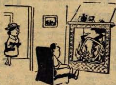
— Ah je bil nocoj dober program, dragi?

dokumentl • dokumentl • dokumentl • dokumentl • dokumentl • dokumentl • dokumentl • dokumentl • dokumentl