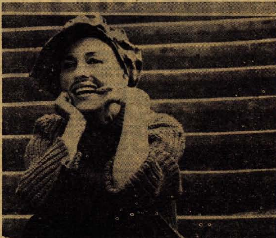
Ena najboljših igravk francoskega filma in ena najbolj priljubljenih igravk »novega vala« je Jeanne Moreau, ki je oblikovala tu di glavno vlogo v zadnjem Truffautovem filmu »Jules in Jim«.

Nekdanji advokat André Cayatte je (v sodelovanju s scenaristom Charlesom Spaakom) s štirimi filmi ostro napadel francosko sodstvo in »nepravičnost pravice«. To so »Pravica je zadoščeno« (1950), »Vsi smo morilci« (1952), »Pred potopom« (1953) in »Črni dosije« (1955), pri čemer je najboljši film »Vsi smo morilci«, ki je tudi v največji meri dosegel Cayattov namen: zbuditi gledavca iz lagodnega posploševanja v konkretno razmišljanje in družbeno ukrepanje.