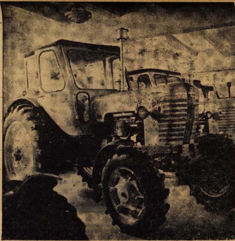
Konstruktorji tovarne traktorjev v Minsku so izdelali nov model traktorja na kolesih. Traktor ima vgrajen Diesel motor. Menjalnik ima devet prestav. Zaradi tega se lahko giblje zelo počasi 1,2 kilometra na uro in precej hitro 24,3 km na uro. Motor je vzdignjen nad zemljo skoraj 64 cm visoko. Tako lahko traktor obdeluje tudi polje z visokimi kulturami.

Vsemu se da pomagati. Na podoben način, kot so si pomagali Američani, bi si lahko tudi vsi drugi. Na odseku ceste New York—Philadelphia v zvezni državi New Jersey — so napravili avtomobilsko cesto s štirimi cestnišči za hiter in počasen promet, in to predvsem zaradi pogoste in hude megle. Tako se je znižalo število mrtvih v prometnih nesrečah na tej cesti za celih 90 odstotkov. Pred dvajsetimi leti so bile ZDA pred istim problemom, kot je danes Francija. Odpravili so ga hitro in uspešno. Kako pa bo v Franciji, tega pa še ne vemo.