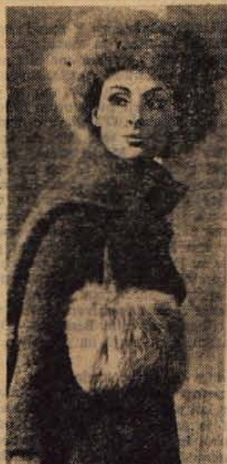
Tudi v letošnji zimi nas bo krzno toplo spremljalo. Pokrivalo na sliki je iz tvida, obrobjeno pa z dolgodlakim krznom — Hsico

● Hubertus je dolgo vlaknati in nepremočljivi loden, namenjen zlasti za lovske verjeh.