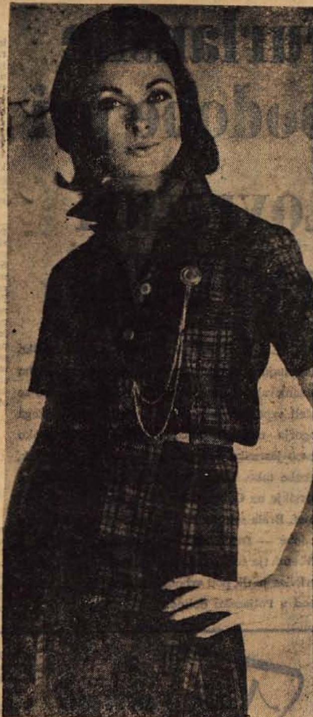
Škotski vzorec predvsem rade nosijo solarke in mlajše žene. Tudi model na sliki je zelo mladosten in predvsem primeren športnemu tipu.

Zastarele in krónične angine so često vzrok raznim revmatizmom, ledvičnim in srčnim obolenjem. Vse angine so nalezljive. Bolnik naj pogosto grgra topel čaj iz dišeče mete ali ajbiša.