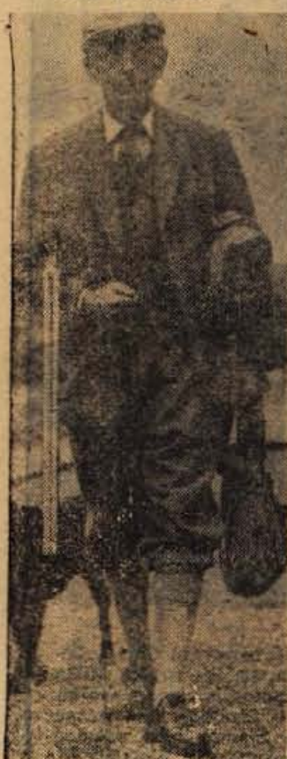
Britanski premier Home