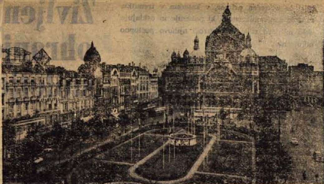
Antwerpen je slikovito mesto in največje belgijsko pristanišče. Na sliki vidimo trg pred železniško postajo in poslopje postaje. Pred postajo je kraljevi park

V Antwerpnu smo si ogledali tudi kraljevi muzej lepih umetnosti. Ta ustanova privablja številne obiskovavce, saj ima bogato zbirko 1000 slik starih mojstrov in okoli 1500 slik modernih avtorjev od 19. stoletja dalje. Najštevilnejše so tu predstavljeni mojstri stare flamske generacije 15., 16. in 17. stoletja. Med mnogimi dragocenimi platni so tu tudi številna dela P. P. Rubensa. Mnogo časa porabi človek, da si ogleda vse to, toda še zdaleč ni videl vsega, kajti tu so še številni muzeji kot na primer muzej arheologije in zgodovine, muzej pomorstva, muzej folklorne, muzej Smidt van Gelder z dragocenim porcelanom, muzej Mayer van der Bergh, ki mu pravijo tudi biser muzejev v Antwerpnu. Tu so najlepša dela flamske slikarske šole, med katerimi so dragocena platna Pietra Brueghel starejšega in nazadnje še Rubensova hiša, stara patricijska rezidenca, zgrajena leta 1610, leta 1946 pa so jo popolnoma restavrirali in preuredili v muzej, ki je v Antwerpnu najbolj obiskan. V prostornih sobah visijo platna primitivnih flamskih slikarjev, Rubensovih predhodnikov pa tudi sodobnikov. Opremljeno je s pohištvom, ki so ga darovali »člani kluba ljubiteljev Rubensove hiše«, sem ter tja so postavljene po mizah dragocene vaze, omarice, ure itd., vse prav tako darilo »članov kluba.« Vsaka teh sob ima kamin in tlakovano pod. Po daljšem sprehodu po sobah prideš po stopnicah do balkona, kjer lahko kakih osem metrov pod seboj vidiš nekdanji Rubensov atelje. Če vržeš okoli 150 dinarjev v