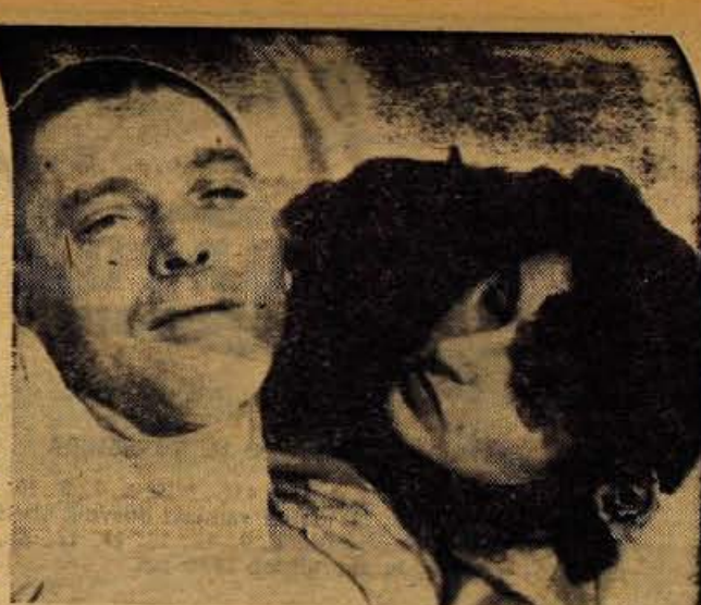
Eksplozivno temperamentna Italijanka Anna Magnani je za svojo vlogo ob Burtu Lancasteru v Mannovem (1955) prinosu Williamsove »Tetovirane rože« dobila Oscarja

Vrnitev pevke Lillian Roth, ki je bila po lastnih besedah »zvezda pri osmih in pijanka pri osemindvajsetih«, k umetniški slavi je pritegnila pozornost javnosti še bolj kot večina takih že samih po sebi popularnih dogodkov... To predvsem zaradi življenjepisa, ki ga je objavila pod naslovom »Jokala bom jutri« in prodala več kot milijon izvodov.