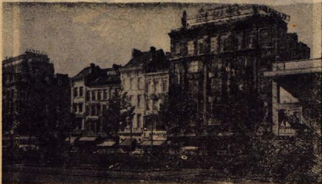
Zelenja v pristaniškem Antwerpnu ni malo. Tudi tam kjer je videti, da ni veliko prostora, so mestni očetje zasadili gredice in rože. Na sliki je znan trg Astrid

Glave se stiskajo nad malo stekleno vitrino in oči se kar nočejo odmakniti od nenavadnega predmeta.