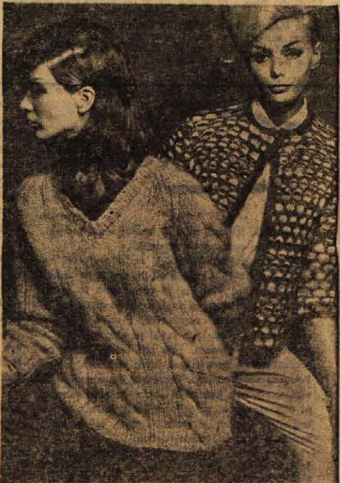
Kar hitro se moramo odločiti za zimsko lopico ali pulover, da ga bomo pravočasno spletele. Morda sta vam modela na sliki všeč in se boste za enega izmed njiju odločile