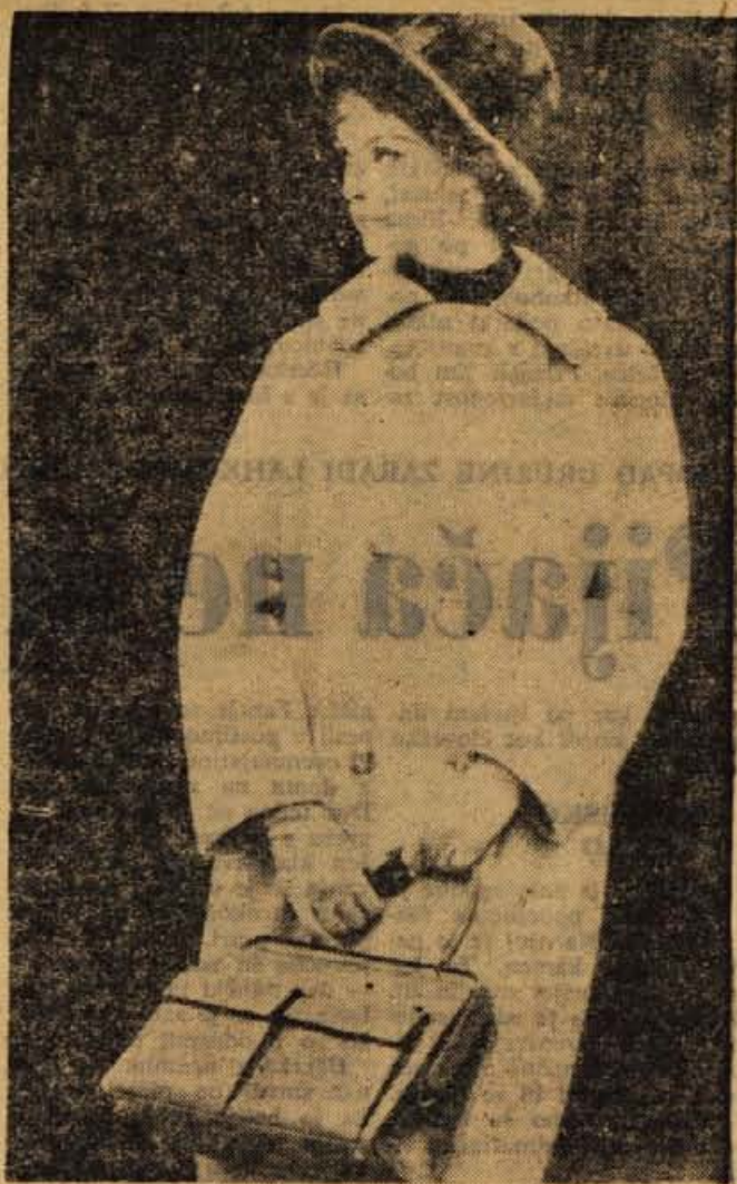
Preprost dvoredno zapet plašč je narejen iz svetlega velurja

BOLNIK mora takoj v posteljo in ležati, dokler traja vročina ali telesna temperatura nad 37°C. Pije naj lipov ali bezgov čaj z dodatkom mete. Proti glavobolu naj bolnik vzame tablete aspirina nekajkrat na dan ali piramidona. Če ima bolnik znatne bolečine tudi v prsih, kar je pri tej bolezni zelo pogosto, naj vzame trikrat do štirikrat na dan po dve tableti sulfokombina, da se tako v kali zatre razmah bacilov, ki povzročajo vnetje pljuč. Pri otrocih ravnamo prav tako, le da dajemo zdravila v primerni manjši količini.