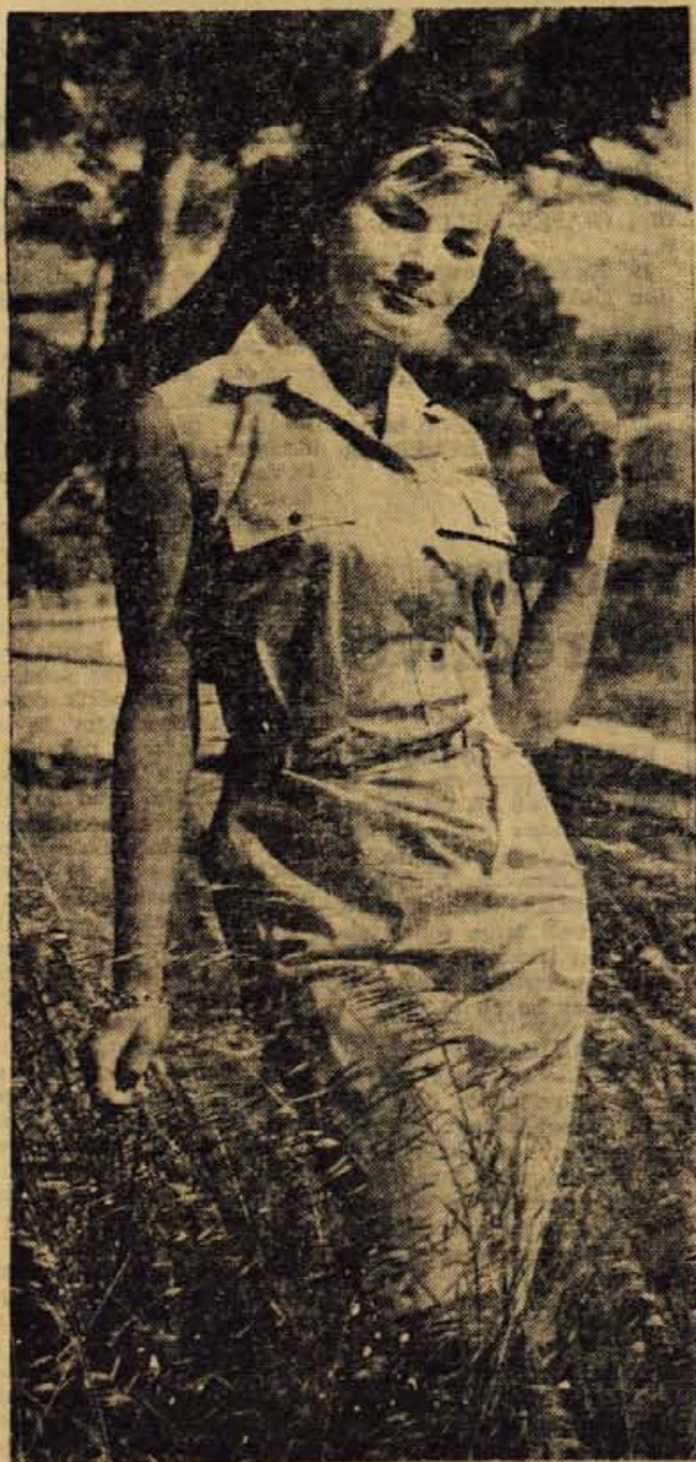
Obleka, ki bo pristojala mladi deklici ali zreli ženi, vitki ali močni postavi

Jed izboljšamo, če možgane pred serviranjem glaziramo na surovem maslu. Zraven ponudimo slan ali pečen krompir in razne solate.