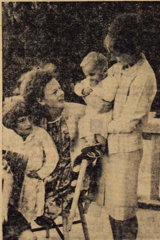
Skupina skopskih otrok v Dvorski vasi pri Radovljici

Votlini, kjer je divji mož požrl vse ovce nesrečnega pastirja, pa so Dovčani vzdeli ime: Ovčja jama.