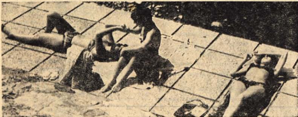
Premalo skrbimo za čista in lepa kopališča

Tudi promet razveseljivo narašča. Od leta 1958, ko so ga prvič začeli beležiti — bilo ga je 50 milijonov — pa do letošnjega leta, je narasel skoraj za pol milijarde. To dejstvo je vsekakor izredno razveseljivo za vse tiste, ki razstavlajo, in pa tudi za tiste, ki kupujejo. Za prve pa je tudi dobra spodbuda za prihodnje sejme, da bodo ti še boljši in še bolj pripravljeni. — T. J.