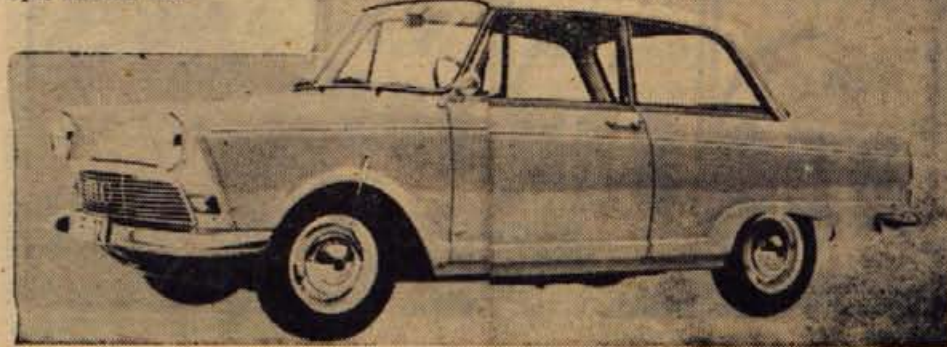
Opel Rekord 1963

V jeseni nameravajo prikazati izboljšani motor pri DS 19 , ki ima že tako nekaj odličnih sposobnosti. Moč motorja se bo pri istem številu obratov povečala na 104 KS, s čimer bo lahko avtomobil dosegel hitrost 170 km na uro. To je približno 10 kilometrov več kakor sedaj. Motor bo na splošno izboljšán za 20 odstotkov in bo mehanično vzdržljivejši.