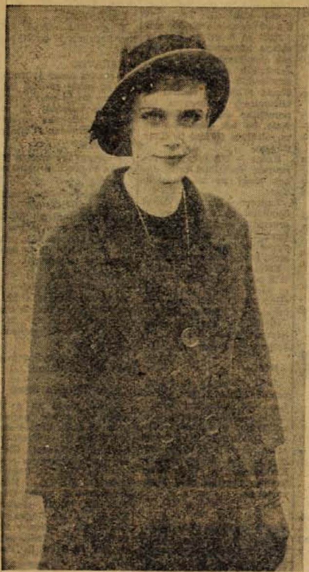
Ozek plašč z vstavljenimi rokavi in s tremi zanimivo prilitimi gumbi.