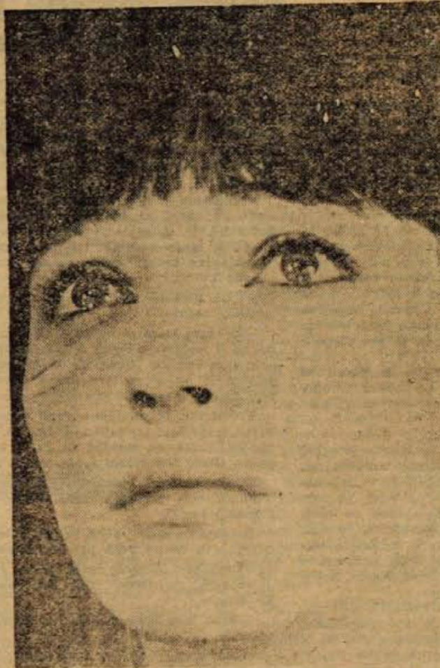
Anna Karina v Godardovem filmu »Živel svoje življenje«, ki je bil najboljši film na lanskem beneskem festivalu, čeprav je dobil samo posebno nagrado žirije