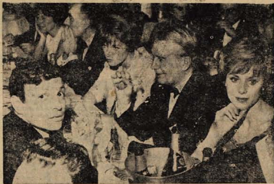
V znanem pariškem zabavišču »Lido« so se pred kratkim zbrale vse veličine svetovnega filma. Na prireditvi so bili ameriški, francoski in Italijanski filmski igravci. — Na sliki vidimo Mauricea Chevaliera sredi nemških dvojčic pevk sester Kässler