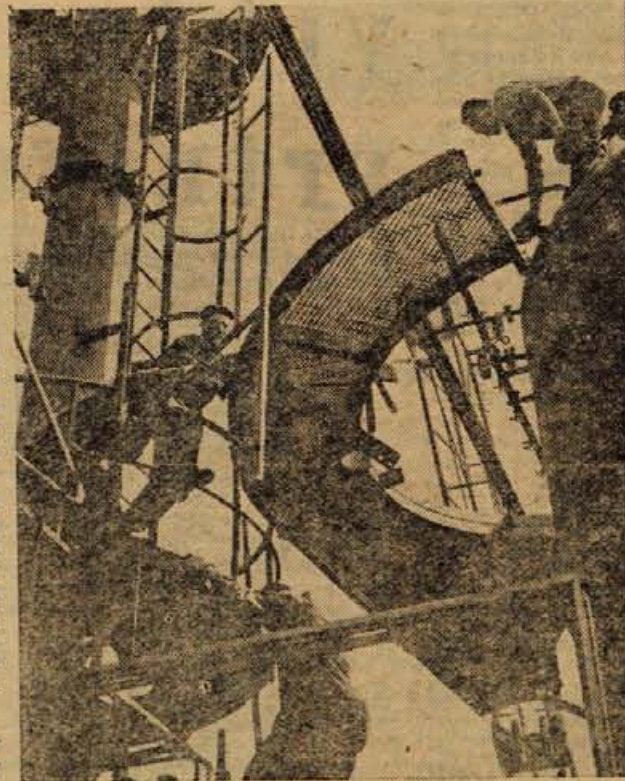
V Kralupima na Vltavi gradijo veliko kemično tovarno za proizvodnjo sintetičnega kavčuka

Vrednost minute je torej mogoče ocenjevati z mnogih stališč. Ko so te številke izšle v enem izmed zahodnonemških časopisov, so kritični bralci statistikom zamerali, da niso zajeli zelo pomembnega podatka: kolikokrat v eni minuti žene po svetu povedo nestrpnemu možu popolnoma netočno časovno napoved: »Tako, dragi! Čez minuto bom gotova!«