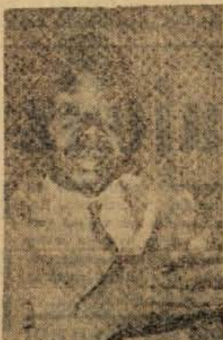
Katanški secesionist Combe

Katanga za Kongu ni samo politična postavka za dosego enotnosti in neokrnjenosti. Katanga je po kongoških državnih podatkih veliko bolj pomembna v gospodarskem smislu. Katanga je najrazvitejša kongoška pokrajina, ki po rudnih bogastvih spada med najbogatše predele v črni Afriki. Važno je tudi, da se ta ogro-