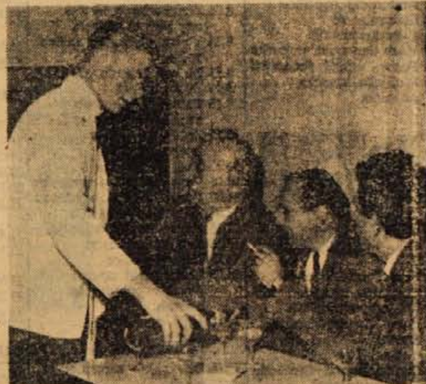
Nekateri se raje zavrtijo, drugi pa v družbi prijateljev in ob polnem kozarcu rečejo marsikatero »krepko«.

»Dancing« je za Kranj vsekakor pomemben, saj predstavlja hotel sam vmesno postajo potnikom iz Avstrije, Danske in Belgije, ki so namenjeni k morju. Ker je lokal odprt vsak dan, bo precejšnji inozemski gost prav rad preživel večer v plesu ob glasbi, ki s svojim repertoarjem zadovolji še tako različne in zahtevne okuse. – T. P.