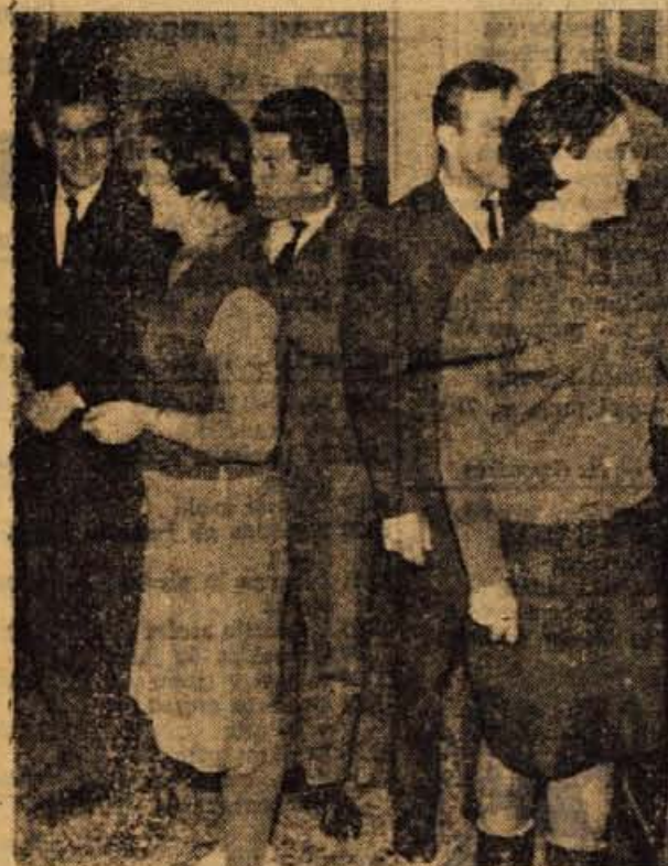
Da bi se gostje počutili kar najprijetneje, so pred »dancingom« uredili tudi garderobo.

obveze in geslo: gost naj se zabava tako, da ne bo motil zabave drugih. Upravičeno lahko trdimo, da jim je uspelo, saj se prvi uspehi kažejo že sedaj. Razveseljivo je dejstvo, da so se tisti, ki so bili prej poznani kot razgrajaci, spremenili in pomirili. Tudi novih obrazov je v novem lokalu vsak dan več. S tem pa je bil dosežen tudi namen »dancinga«. Gost, ki bo lokal zapustil z dobrim vtisem, se bo prav gotovo še vrnil. Mnogi se bodo spraševali, le kaj je novega, da tako privlači. Odgovor na to vprašanje vsekakor ni enostaven, resnica pa je, da so k ustvaritvi dostojnega vzdušja brez dvoma mnogo pripomogli tudi preurejeni prostori, ki vzbujajo vtis velemostnega lokala.