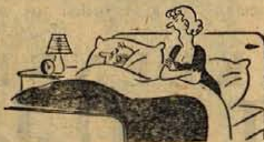
- Ne razumem, kako pri svoji plači tako mirno spiš?