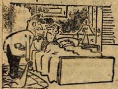
- Kaj nimate ničesar za ukraši?