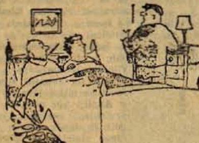
- Zelo žal mi je, da vas moram zbuditi, nisem namreč našel denarja.

dokumenti • dokumenti • dokumenti • dokumenti • dokumenti • dokumenti • dokumenti • dokumenti • dokumenti • dokumenti