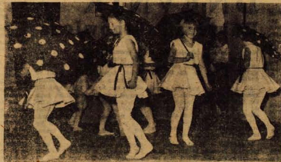
Nastop najmlajših telovadk s točko »pod dežniki« na telovadni akademiji v Gorjah