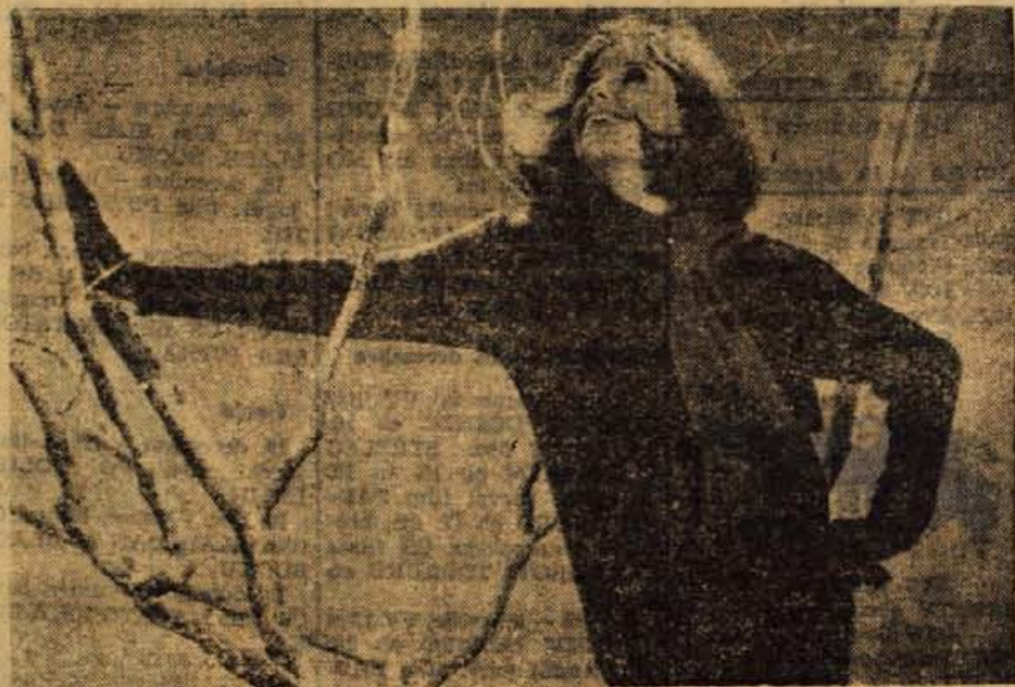
Prve snežinke so že pobelile tla in športni puloverji so zavzeli pomembno mesto v garderobi. Prav posebno so letos priljubljeni šali, ki si jih vržemo okoli vratu

Kaj pa bi razveselilo ženo ali deklet? Pogledimo! Lepoga dežnika bi bila verjetno prav vsaka vesela; če ne moremo seči tako globoko v žep, je prav prijetno darilo lep karivasti športni šal ali usnjene rokavice. Letos so zelo moderni puliji z visokim ovratnikom, morda bi z njim razveselili ženo. Pripravno darilce mlademu dekletu je šatulja za nakit ali mala kozmetična torbica. Zelo lepe lakaste torbice vabljivo kuhajo iz izloženih obel; če bočemo napraviti nehomu veselo, jo kar hitro kupimo. Verjetno bo vsaka žena — gospodinja vesela tudi gospodinskih pripomočkov.