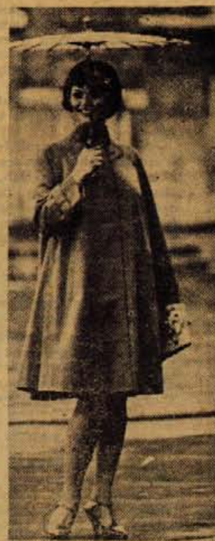
Claudia Cardinale v Bologni: njejem filmu »Senilnost«

Angleški producenti in režiserji se velikokrat pritožujejo nad slabim vremenom, ki jim vedno znova prekriza načrte. Toda medtem ko so bile njihove pritožbe zaradi izredno slabega poletnega vremena še posebno glasne — je bil eden izmed njih še vesel. Tony Richardson bi namreč rad, da bi bil njegov »Tom Jones« tudi glede vremena resnično angleški. Tako so se v Angliji menda prvič zaslislale besede: »O.K., sonce se je skrilo. Snemanje!«