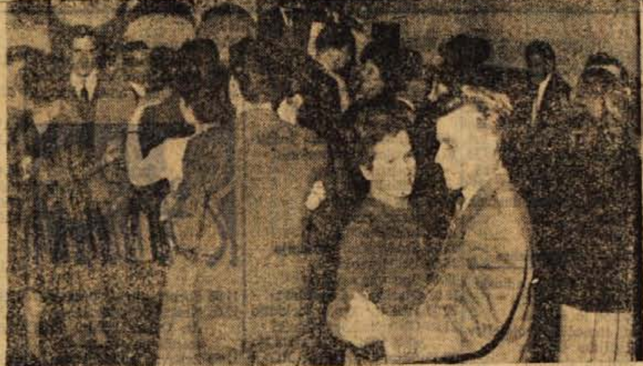
Lepo urejen lokal, prijetna glasba in nasmejani obrazi so pojem za marsikatero gostinca. Da je prav tako vzdušje uspelo ustvariti kolektiv hotelu »Evropa«, je za nas vsakakor razveseljiva novost.

vpitem lokalu v Kranju se je vedno bolj širil. Uprava hotela »Evropa« si je dolgo belila glava z rešitvijo tega problema in jo tudi našla. V oktobru so pričeli z adaptacijo kavarne in 28. oktobra je bil v Kranju odprt nov lokal »dancing«. Naziv je tuji, pomeni pa ples, čemur ustreza tudi sam lokal, saj je le-ta nekaj med kavarno in barom. Z novim lokalom je podjetje prevzelo nase nove