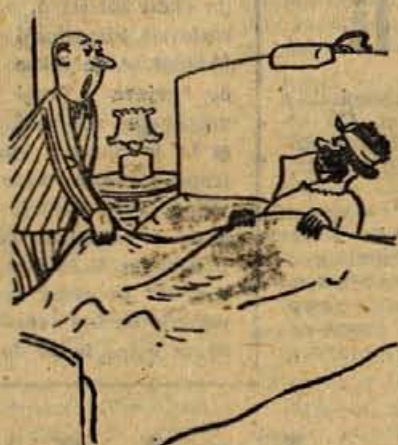
- Kdo mi jamči, da si zares moja žena?