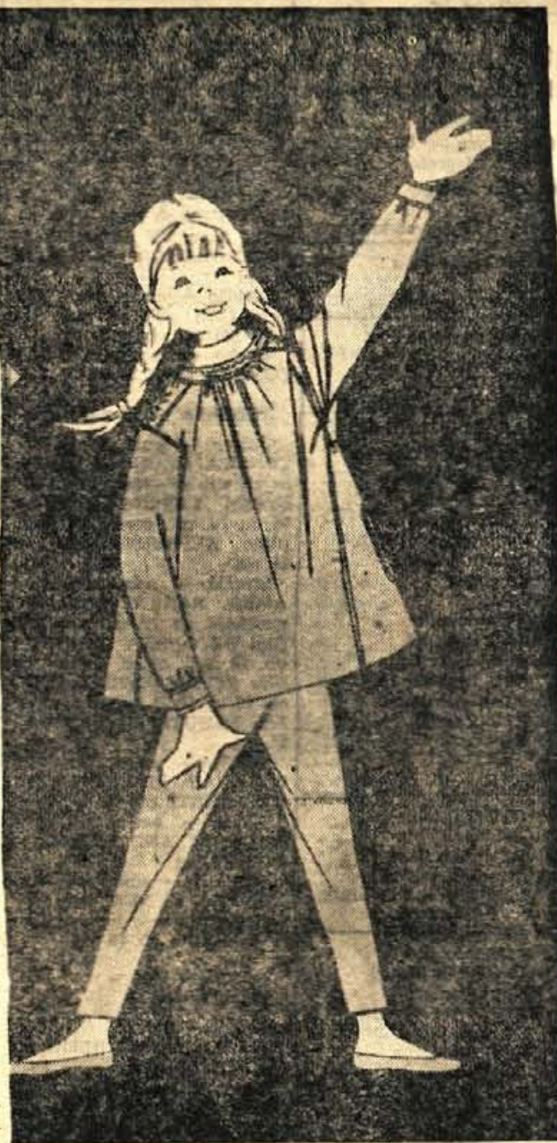
Prilavna daljša jopica za naše matere. Pri igri se otrok vedno umaže in mamici bo dosti dela prihranjenega, če bo otrok preko puloverja imel tako oblačilce. Zaperja se zadržaj z gumbi in se lahko nosi tudi tako, da so gumbi spredaj

Prilava: Pomaranče olupimo in jih na kose razdelimo. Prav tako grapefruits olupimo in razrežemo na manjše koščke. Osladkamo z nekaj žlicami medu in medena solata je pripravljena.