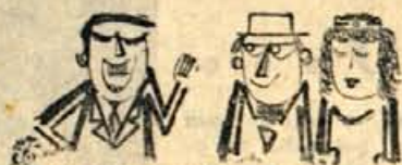
Zaradi kaljenja javnega miru boste plačali pet tisoč dinarjev kazni!