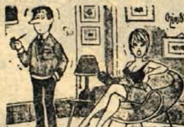
— Prenehaj že godrnjati... Ze pr poroko sem ti povedala, da v kuhinji ne zmorem velikol