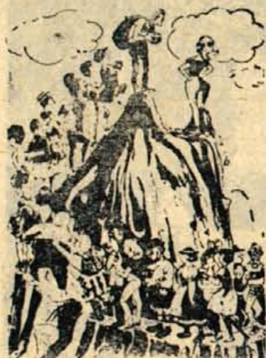
— Halo vi spredaj pohitite, tudi mi imamo fotoaparate...