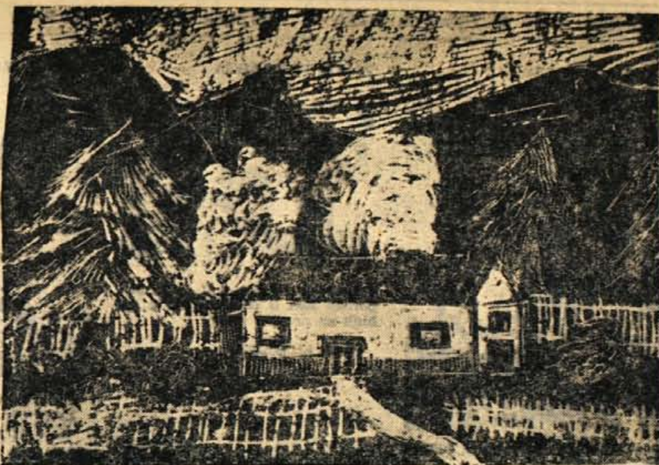
Arezanovič Vlado: »Pokrajina«