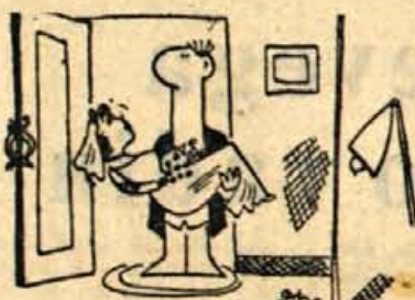
— Draga, moram ti takoj povedati, da ne znam kuhati.