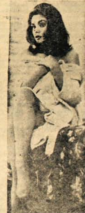
Osnovno pravilo za uspeh pri filmu postaja vedno bolj pogosti prizori, ko igravke razkazujejo telesne čednosti

V iva film bo v sodelovanju z uredništvom »Pavilhe« posnel serijo kratkih dokumentarnih humorističnih filmov z aktualno tematiko iz vsakdanjega življenja. Filme bodo ponudili »Filmskim novostim«, gledali pa jih bodo najbrž tudi na televiziji. S tem je