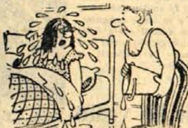
— Ko smo bili novoporočenci si me zbudil s poljubom...