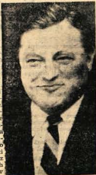
Franz Josef Strauss

Ob jesenskih manevrih zahodnonemške vojske je hamburški list kritično pisal o pomanjkljivosti in za neuspehe okrivil obrambnega