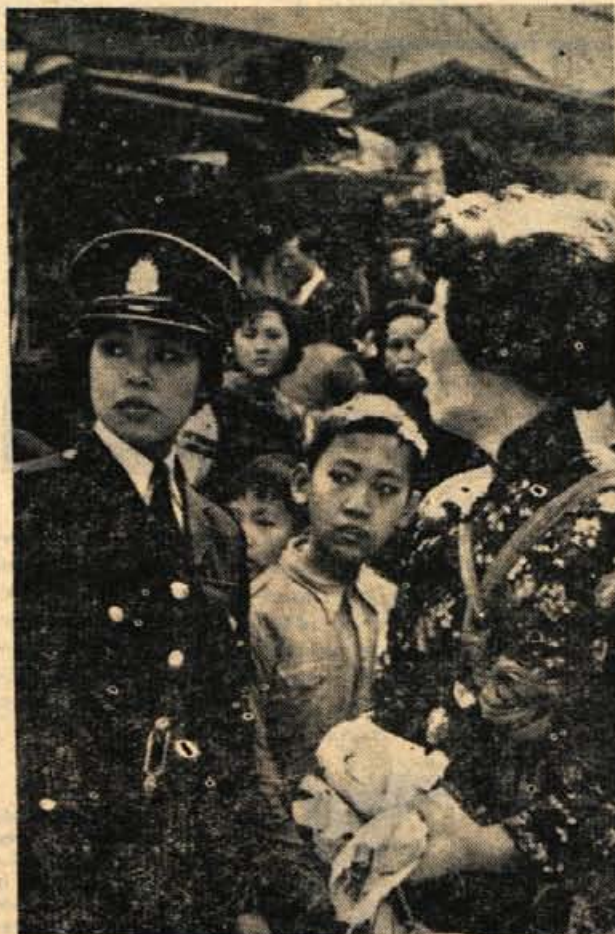
Ženske v uniformi so veliko bolj prijazne kot moški. To pravijo potniki, ki so se vrnili iz Hongkonga