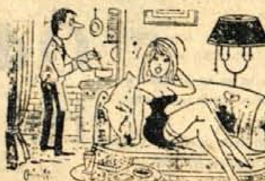
— Ker mi vedno prigovarjaš, da nisposliti. Vem za nekega slikarja, ki česar ne delam, sem se sklenila za-išče model.