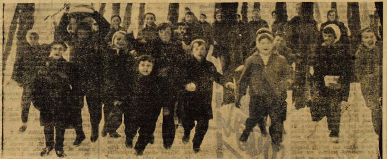
Počitnice so se začele, sneg je pa zginil še preden smo razvili film. Takšne vremenske prilike res ne obetajo otrokom, da bodo našli v letošnji smuhaski zimi kaj razvedrila na snegu

Pravilne odgovore bomo nagradili. Izrečani dobitnik s pravilnimi odgovori bo dobil denarno nagrado 500 dinarjev. Odgovore pošljite na naslov uredništva z označbo »Mlača rasti«.