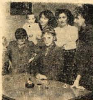
Sedem otrok in žena je našlo krov nad glavo v Škofji Loki

Ljubimec »slabih žen« Alain Delon je prisel v Beograd, kjer bo dva meseca snemal film »Marko Polo«. Ze prvi dan bivanja v Beogradu je doživel celo odisejo. Najprej je na Kalemegdanu bežal pred hitrimi »beneškimi stražarji«. Ta dan so namreč začeli snemati prve prizore. Zvečer sta ga zaustavili dve dekleti, ki sta želeli, da bi ta večer preživeli skupaj.