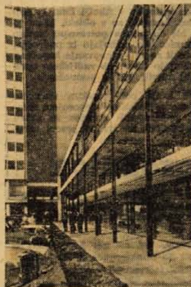
Nova mesina četrt v Stuttgartu, ki ima sijaj »nemškega gospodarstvenega čudeža«

Če se vrnete, se lahko zaposlite pri nas, mi je rekel s poslovnim in skoraj lokavim nasmehom eden izmed uslužbencev Mercedesovih tovarn, ki je bil nekoč Slavonec. V veliki avli pred muzejem tovarne sem za hip poški-