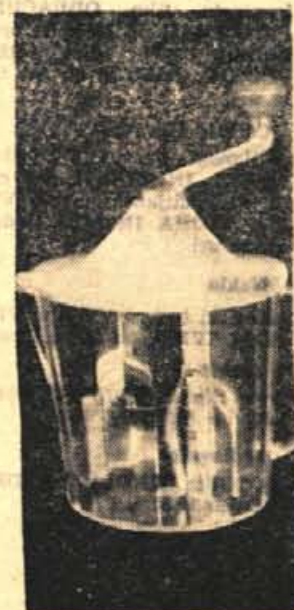
V irgovini "IDEAL" dobite prav praktične gospodinjske pripomočke

Puloverji so že dlje v modi. Izdelujejo se iz sintetičnih vlaken in volne. Klasični puloverji z V izrezom in puloverji z visokim ovratnikom so še letos ljubljene moških. Barva medu pa je miedna barva moških puloverjev.