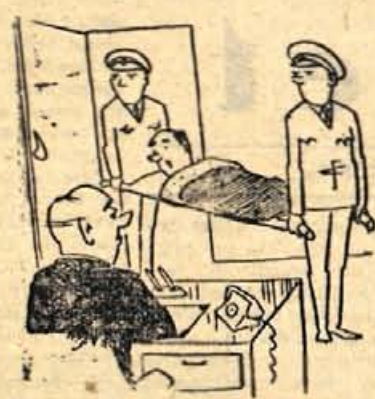
— Šef, ali danes lahko ostanem doma?