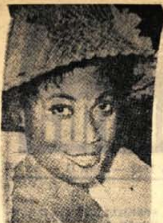
Ministrova žena je morala zapustiti pravilnično palačo in zlato posteljo

Po obisku de Gaulle v Zahodni Nemčiji se je zvedelo, da sta v splošni gneči, ki je bila največja v Kölnu, dobila dva človeka težke telesne poškodbe. Na sprejemih v mestih, ki jih je francoski general obiskal, je bila povsod velika gneča, vendar največja v Kölnu.