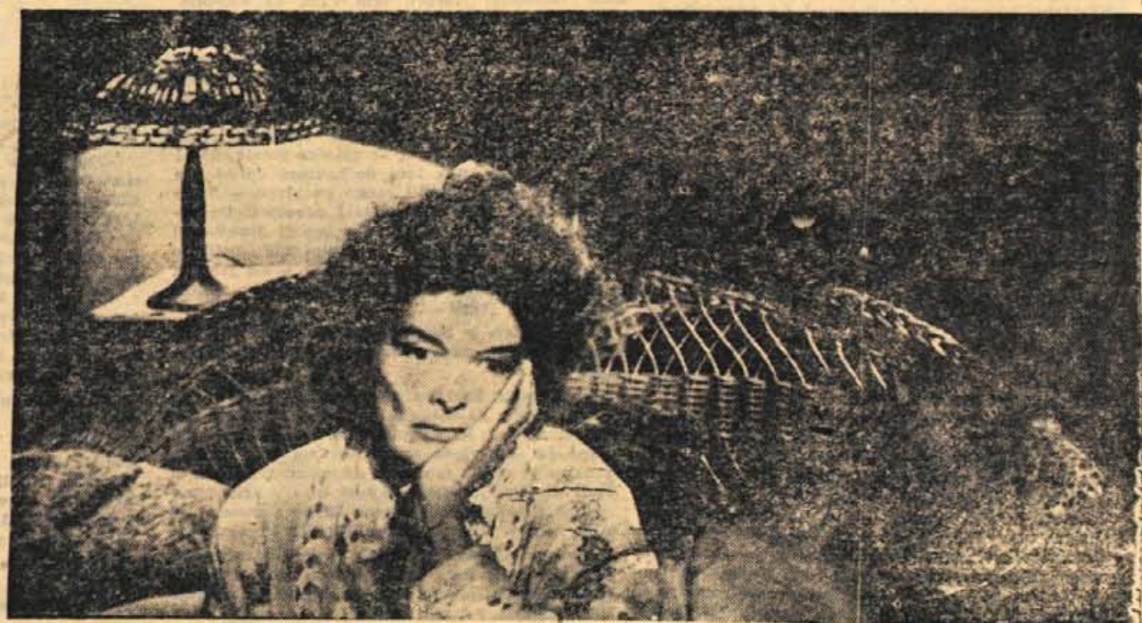
Katherine Hepburn je v odličnem filmu ameriškega režiserja Sidneyja Lumeta »Dolgega dneva počivanja« v neoblikovani vlogi matere, ki se vda alkoholu. Delo je zastopalo ZDA na festivalu v Cannesu, kjer so štiri glavni igralci v njem dobili skupno nagrado za svojo igr

Ne, ne to. Čisto preprosto gre za to, da je bil moj oče skromen človek, ki ni verjel, da bi bila njegova odkritja dovolj pomembna ali dovolj raznolika, da bi zahimala občinstvo. Menil je, da je prava umetnikova naloga vsrkati material, ga predelati in nato dati naprej. Oblika ni važna; lahko je to Picassova kubiistična oblika, Mondrianova abstrakcija ali njegova lastna figurativna tehnika. Toda ni verjel v idejo človeka kot boga, ki je sposoben ustvarjati iz nič. Resnično je soglašal s tisto Lavoisierjevo mislijo, ki jo gotovo poznate: »V naravi se nič ne ustvari, nič se ne izgubi, vse se preobara...« No, to je tisto!