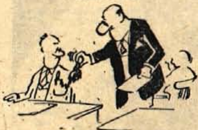
— All lahko vzamem vaše nalivno pero?