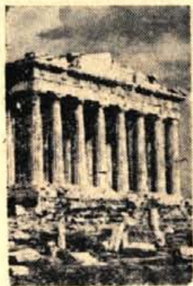
Pet dni po grškem kopnem in morju