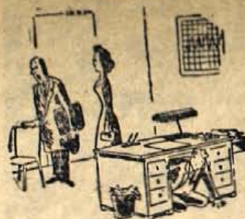
— Ze dobro, ga bom pa počakal.