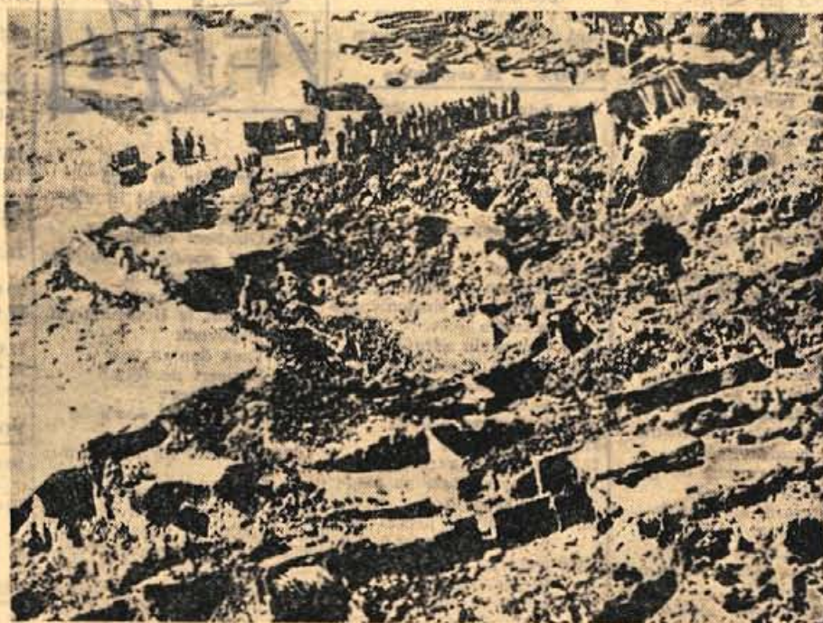
Grozljiva slika kraja, kjer je nekoč stala vas. Po potresu so ostale samo ruševine ladje «Vostok II.» v 25 urah

— Njegov oče, mati, babica, pet bratov, dve sestre,