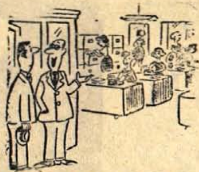
— Kaj res mi-lite, da bom kupil avtomatičen stroj in zamenjal ta dragocena bitja.