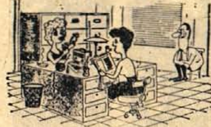
— Končno sem zvedela, da je ta tip, ki že tri dni sedi v pisarni in ne premakne oči s tebe, uradnik zavoda za racionalizacijo dela.