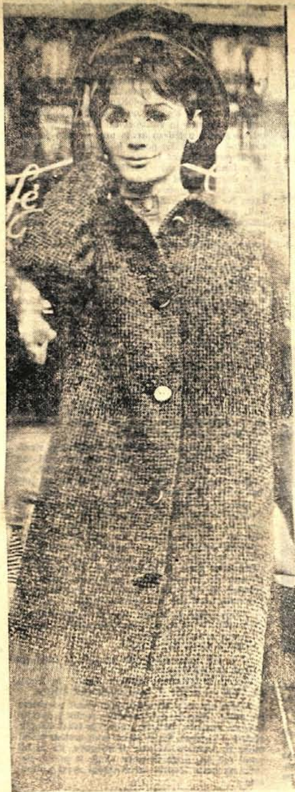
Ozek redingot plašč za jesen. Blago je tvid in je primerno za vsako postavo