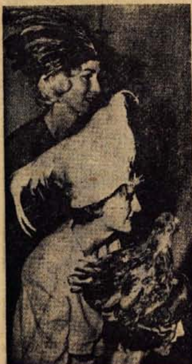
Te ni predpusna domisljica, ampak »uspel« model ženskih klobukov