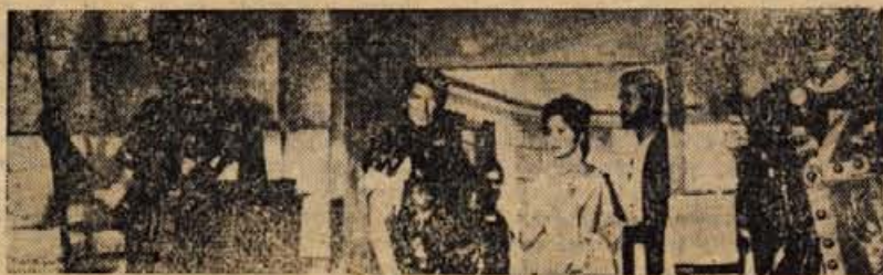
Množičen prizor iz italijanskega filmskega spektakla