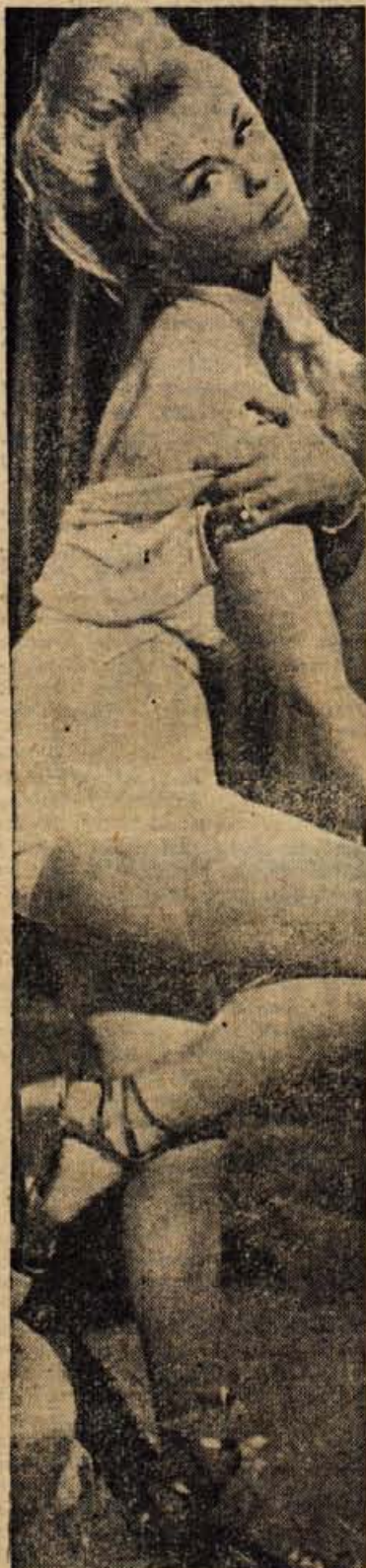
Igralka, ki stoji na eni nogi, je filmsko odkritje Elka Sommer, ki se je v Angliji preiskovala tudi na gramofonskih ploščah