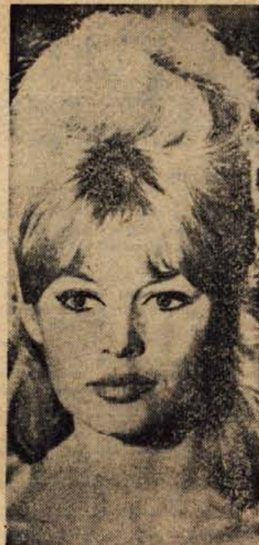
Brigitte Bardot je pred kratkim stopila tudi na politični oder

Vendar upadanja spektakelskega filma – ki se je začelo v tridesetih letih in je trajalo nezadržano vse do pojava širokega platna, nekake renesanse spektakla – niso povzročili samo ekonomski momenti, ampak tudi upadanje zanimanja občinstva za take filme. Vendar si v tem pogledu ne smemo delati kaj preveč iluzij, saj spektakli še