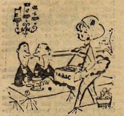
Zdi se mi, da bom zopet začel kaditi