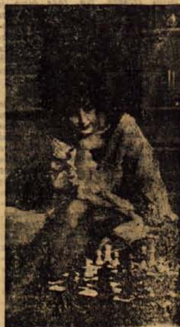
da se je rodila pravzaprav šele takrat, ko je spoznala šah, torej pred 1600 dnevi!