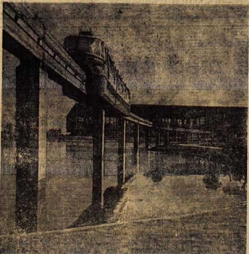
Enolitni vlak, ki je prevažal obiskovalce razstave dela v Turinu