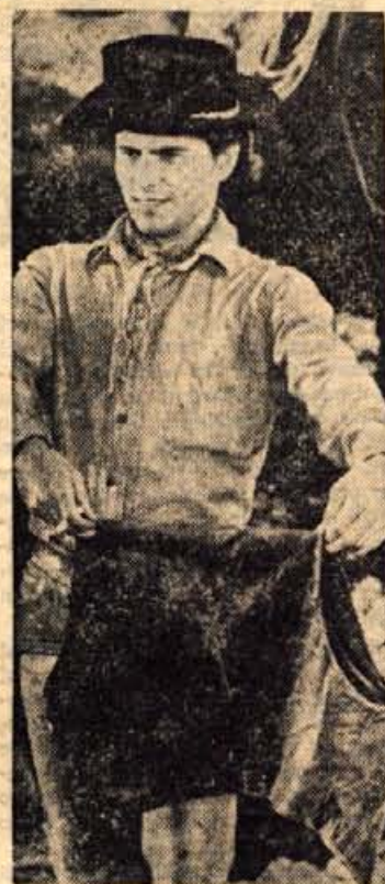
Horst Buchholz je pred kratkim uspelo odigrati eno glavnih vlog v kavbojski verziji znanega japonskega filma Sedem samurajev - naslovljeni Sedem mogočnih

Ce naj na koncu skušamo podati še neko splošno oceno tega žanra, moramo westernu vsekakor priznati veliko notranje zdravje, o katerem priča njegov dolgoletni in uspešni obstoj in razvoj, večinoma zadovoljivo (razen v odnosu do rdečkožcev!), pač pa seveda primitivno moralno stališče; po drugi strani pa ne smemo spregledati preprostosti in celo primitivnosti ter šablone njegove dramaturgije, skoro popolnega izostanka psihološke poglobljenosti (govorimo predvsem o klasičnem westernu), nepravilnosti do prvotnih naseljencev kontinenta (kot eno redkih izjem lahko navedemo Zlomljeno puščico) - če se ustavimo samo pri nekaterih najvidnejših pomanjkljivostih. Seveda pa ta preprostost, ki mпоgokrat zasluži ime primitivnost, ni ovira za skoro brezizjemen uspeh pri občinstvu, ki si pač včasih zaželi kratkega bega iz ne vedno rož-