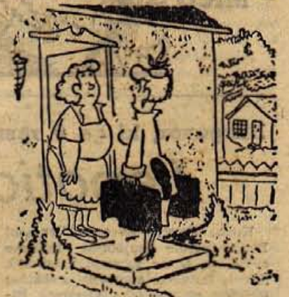
Mama, pustila sem fanta