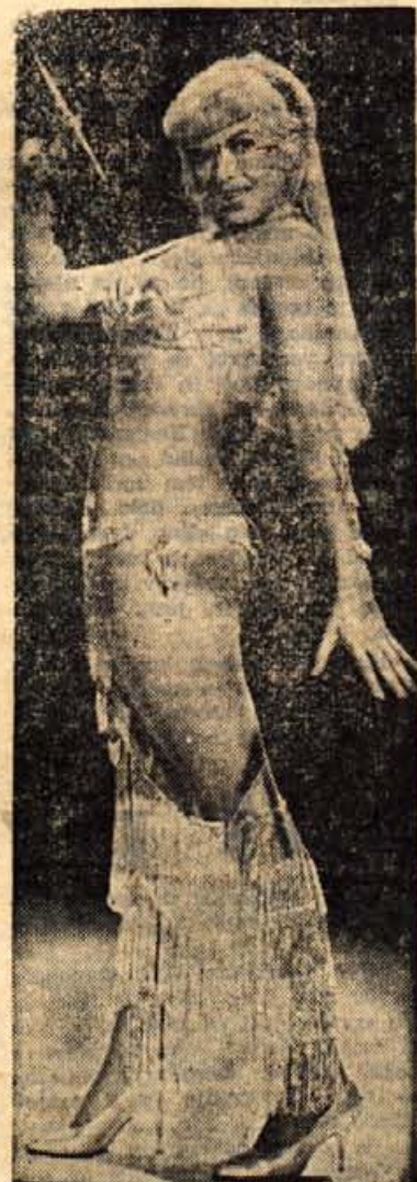
ajne Mansfield, ki smo jo že večkrat videli precej gola pleše neki ritmični ples

Končno nam ostane še, da opredelimo t. im. superwesterne, od katerih smo jih nekaj že imenovali. Superwestern se je rodil v času druge svetovne vojne, ko je zaradi trenutne aktualnosti vojnih propagandnih filmov precej upadla proizvodnja westernov in so njihovi ustvarjalci začeli iskati novih vsebinskih in oblikovnih rešitev v tem žanru. Ravno to pa je superwestern: prekoračenje tradicije tako v vsebinskem pogledu (zgodba z Divjega Zapada je le še osnova za raziskovanje problemov družbe in posameznika ter njegove duševnosti, Divji Zahod je torej samo še slikovito okolje sicer občega - lahko