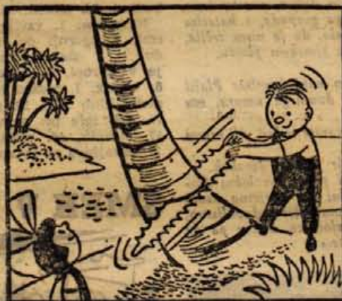
LE SEKAJ, SEKAJ PAL- MICO