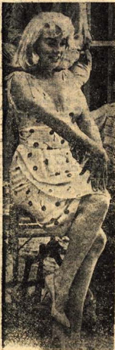
Merlyn Monroe se je uveljavila tudi v westernu