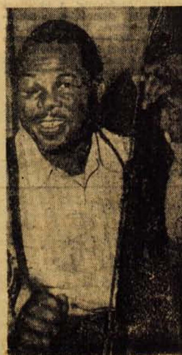
Archie Moore odlično igra na bas

Ob koncu samo še to. Archiejeva slava je še vedno na višku. Toda prej ali slej bo zatonila. Tega se Moore sam zaveda in pravi: »Imam številno družino. Vem da nisem več tisti, kot sem bil. Boksa pa je moj kruh in kruh mojih otrok. Zato bom bokсал dokler bo šlo!«