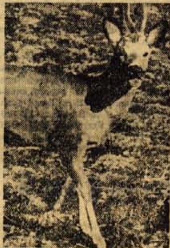
Srna je zaščiten z zakonom

V preteklem letu je bilo po gorenjskih loviščih več kot 5000 gamsov, 293 jelenov, 6704 srnjakov, 42