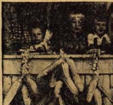
Otroci v koruzi

Skrajšano zgodbičko pa ti bomo objavili v prihodnji številki. Lepe pozdrave tebi in sestri pošilja Tanja