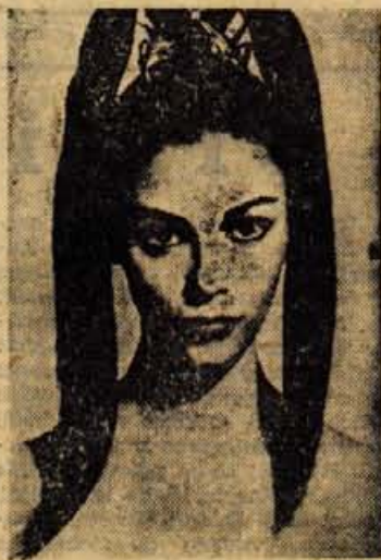
Anna Maria Pierangeli

Vodoravno: 1. kritika, 8. satelit, 9. Ibar, 10. to, 11. Ikar, 14. apel, 16. et, 18. imam, 20. prijeti, 22. okrajan; navpično: 1. ksil, 2. rabi, 3. Itaka, 4. terapija, 5. il, 6. kit, 7. atol, 12. remec, 13. lepo, 15. lata, 17. trk, 19. MIN, 21. ir (idij).