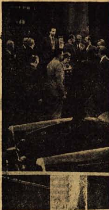
Kranjčane pred mestno hišo v Oldhamu pozdravlja župan mesta

času so zgradili nekaj novih. Stanovanjska so poglavje zase. Se sedaj stanujejo ljudje v provizorijskih, ki so jih takoj po vojni zgradili samo