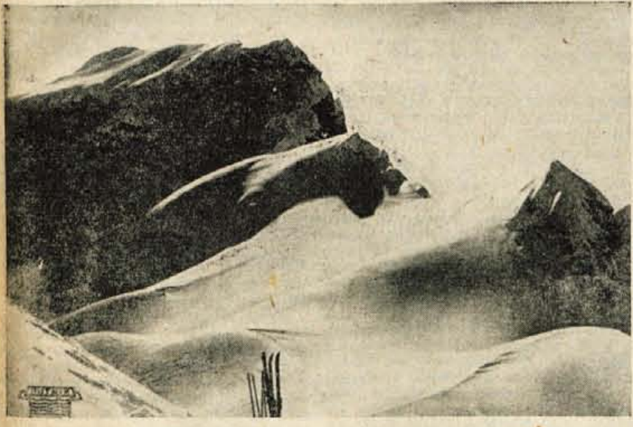
Visokogorska smučišča Pod Voglom - Bohinj