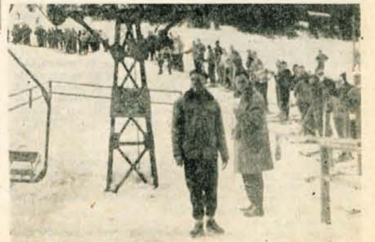
V Kranjski gori je vsak dan več smučarjev

PARTIZAN (Bgd): JESENICE 5:12 Beograd, 10. januarja — Sinoči je bila na umetnem drsališču v Beogradu odigrana prvenstvena tekma v hokeju na ledu za državno prvenstvo med domačim Partizanom in Jesenicami. V lepi igri je moštvo Jesenic znova premagalo Partizana z rezultatom 12:5.