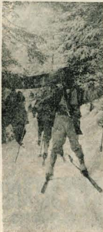
Patrolja na cilju