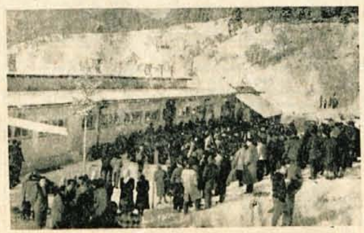
Zborovanje pred šolo v Dražgošah