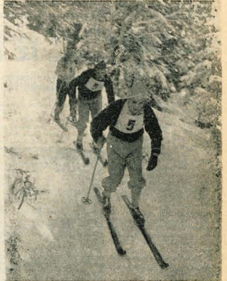
Po stezah partizanske Jelovice