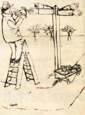
»Ohladilo se je!«

Film, v katerem nastopajo v glavnih vlogah Brenno Mello, Marpessa Dawn in Ademir da Silva, je na festivalu v Cannesu prejel Zlato palmo. Film je režiral Marcel Camus.