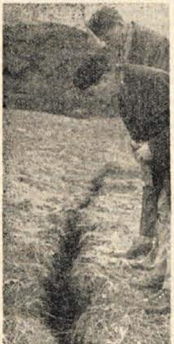
Razpoke v zemlji

Kakih 10 do 15 metrov pod porušeno Debevčevo hišo so otroci v plazju odkrili staro nem-