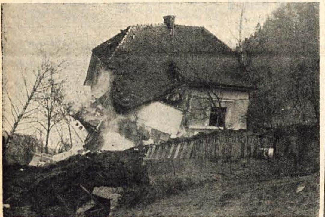
Debevčevo hiša se ruši

RESITEV KRIZANKE ST. 40 Vodoravno: 1. Molnar, 6. odriv, 8. ček, 10. omet, 12. KP, 13. RN, 14. do, 15. Aida, 17. dar, 18. Rinka, 20. ravnik. Navpično: 1. mačka, 2. loč, 3. ND, 4. Aron, 5. Rim, 7. veda, 9. Epir, 11. torek, 13. rana, 16. dir, 17. dan.