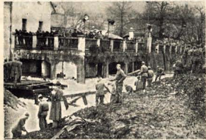
Plaz vse bolj oži strugo Bistrice

Radovljica, 13. decembra: Na redni letni skupščini Zveze Svobod in prosvetnih društev občine Radovljica, ki je bila danes, so kritično razpravljali o dosedanjem prosvetnem delu. V razpravi so govorili o možnosti sodelovanja oziroma izboljšanja dramske sekcije v Lescah in v Radovljici ter o vzdrževanju nekaterih prosvetnih domov.