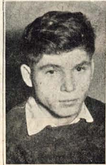
V zadnjem času se intenzivno pripravlja za nastop na državnem prvenstvu v Subotici. Našli smo ga v krogu svojih prijateljev.