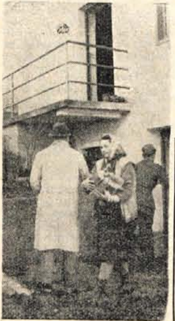
Se drva iz leti — in hiša bo prazna

ško orožje (bombe, granate, nabojne za minometale in puške). Danes dopoldne so iz Ljubljane