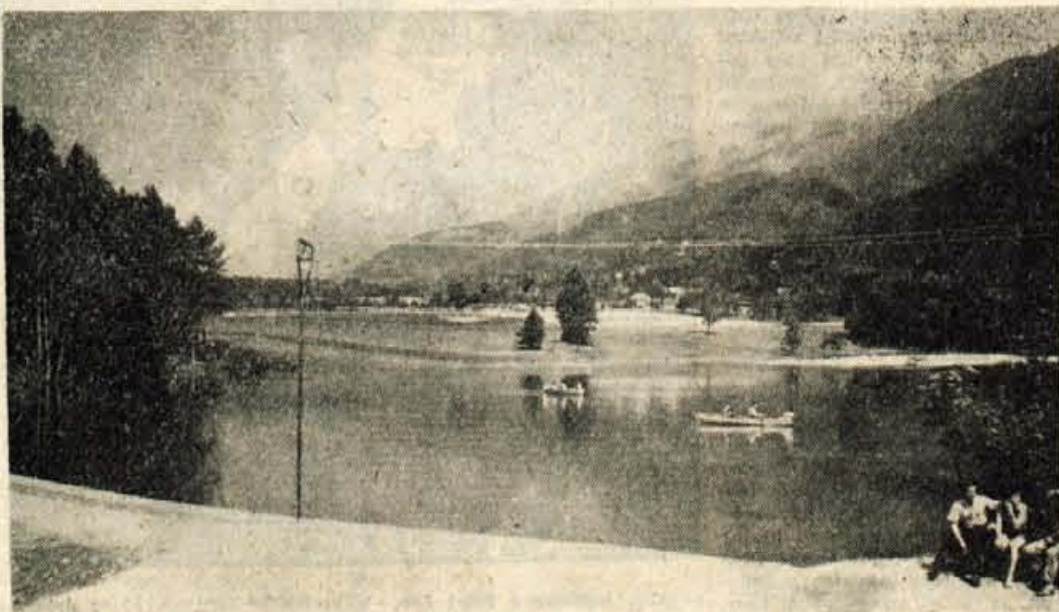
Predvidevanja krajevnih činiteljev, da bo Čmava — umetno jezero v Preddvoru — prinesla turizmu v kraju nove počitnice, so se uresničila. Letošnja turistična sezona je bila v resnici bogatejša od prejšnjih. Dotok turistov in letoviščarjev pa bi bil še večji, če bi bila kapaciteta prenočišč kos velikemu povpraševanju letoviščarjev. Vsekakor pa se je Turistično društvo v Preddvoru znašlo pred težavno nalogo. Do naslednje turistične sezone bo morala kapaciteto ležišč najmanj podvojiti, pa tudi gostinska plat v zvezi s prehrano letoviščarjev bo morala doživeti odločno okrepitev