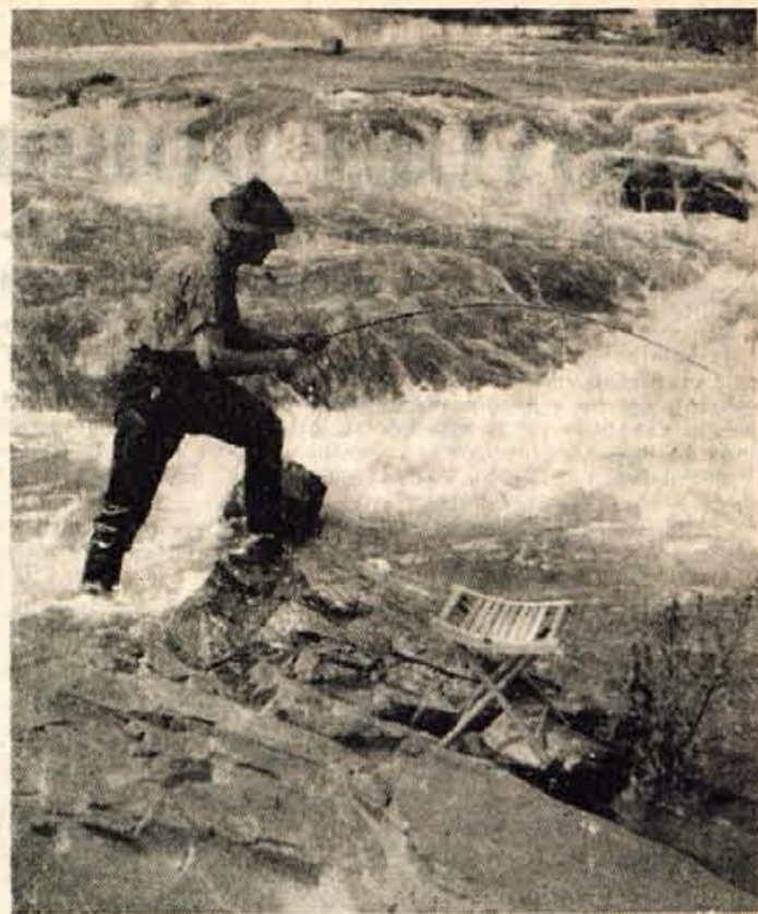
BRZICE NAŠIH GORSKIH REK NUDIJO ŠPORTNIM RIBIČEM DOVOLJ PRILožNOSTI ZA RIBOLOV, SPRETNĚJŠIM RIBIČEM PA TUDI BOGAT LOVSKI PLEN