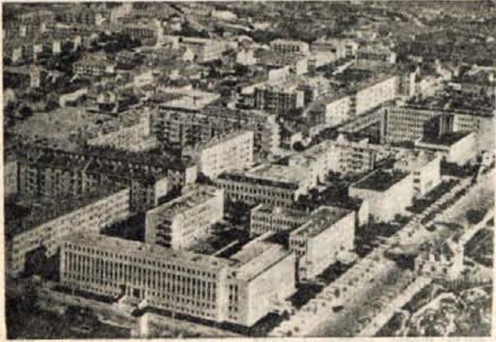
Titograd vztrajno spreminja svojo podobo

ki spominjajo na vojne grozote, kot v Črni gori in malo je predelov, ki bi imeli toliko poti s tolikimi serpentinami in vzponi, kot prav ta košček sveta.