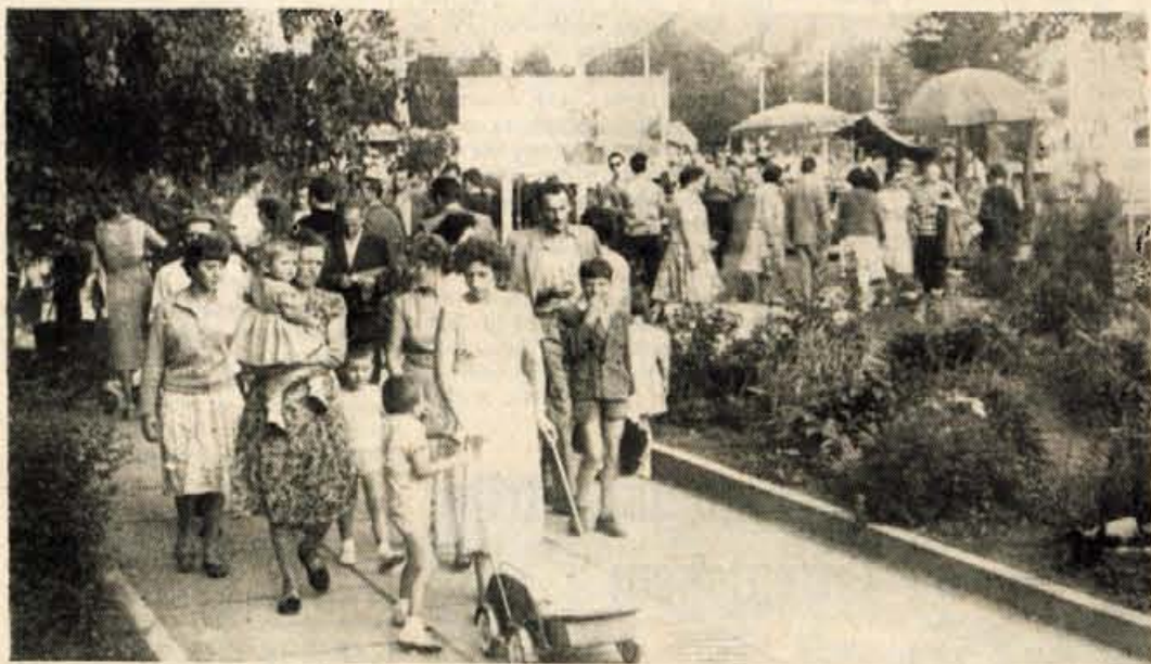
Gorenjski sejem je včeraj obiskalo preko 10.000 ljudi