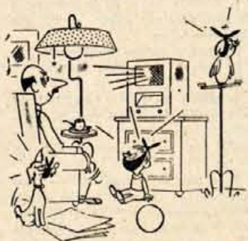
»Poslušajte sedaj najnovejša športna poročila...«