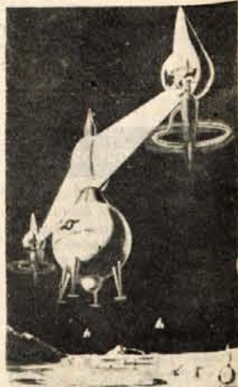
Atomska ladja prihodnosti bo morda lahko poletela do Meseca.