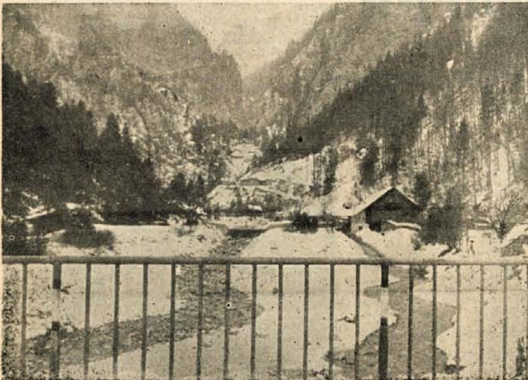
Hudournik Belca priteka iz karavanškega pogorja

Pomlad v zimil... Srečanje s soncem, ki je za našo Gorenjsko neprepeljiva prirodna surovina. Je simboličnega