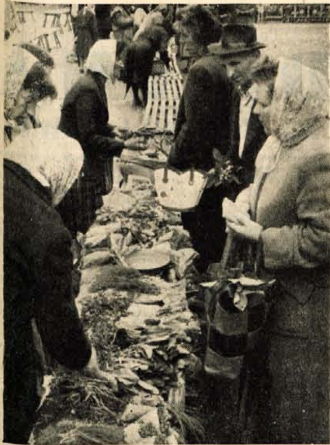
Izbira na trgu večkrat ne zadošča povpraševanju

Regulirali bodo potok Jezernica. Strugo potoka bodo poglobili in utrdili. Istočasno bodo regulirali tudi nekaj hudournikov in pritokov Jezernice. Povečali bodo gostinsko podjetje Dom na Jezerskem.