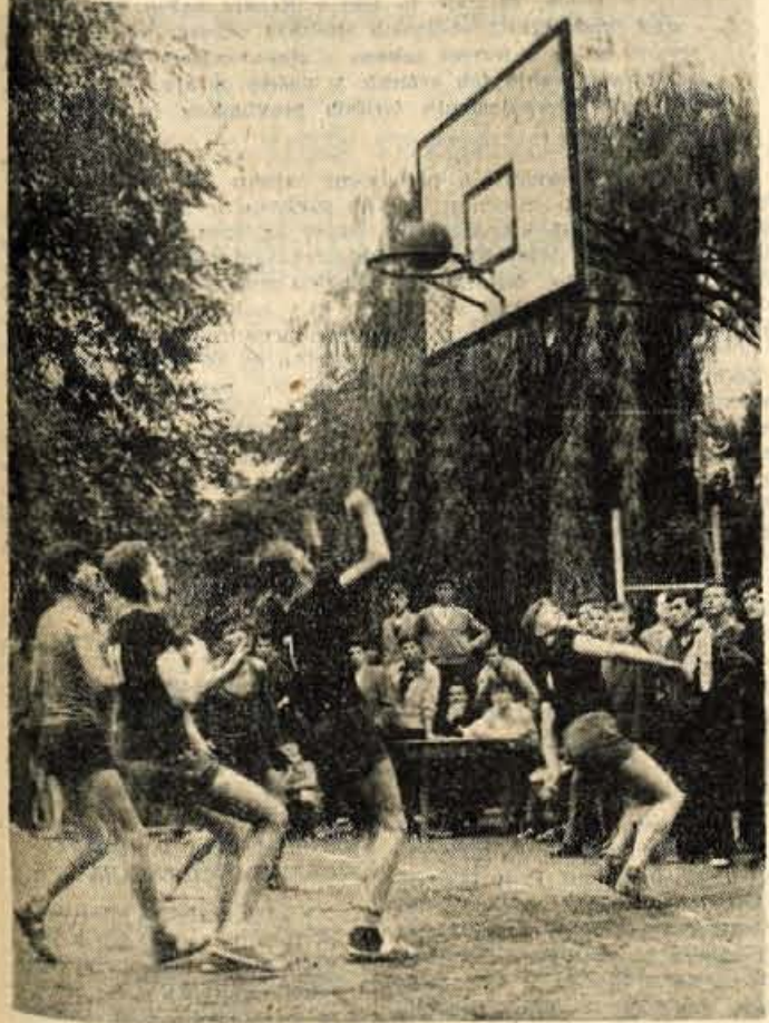
Vsi v napetem pričakovanju, ali bo koš ali ne

Konferenca je obravnavala tudi vlogo komunistov, ki so jo odigrali v dosedanjem razvoju, in poudarila potrebo po še bolj enotnem izvrševanju posameznih nalog. Dosedanje delo komunistov je bilo zlasti osredotočeno v akcijo za večjo produktivnost, za boljše gospodarjenje v podjetjih in kmetih, za reševanje vsakodnevnih nalog ter za izobraževanje odraslih. Omenili so tudi uspehe dosežene na področju uveljavljanja stanovanjskih skupnosti. Na Jesenicah sta dve skupnosti. Prva na Plavžu, ki že uspešno dela, in je organizirala krpčnico ter mehanski servis, pripravlja pa tudi nekaj anket med stanovalci, medtem ko stanovanjska skupnost terena »Sava« še ni našla svojega mesta. (Nadaljevanje na 2. strani)