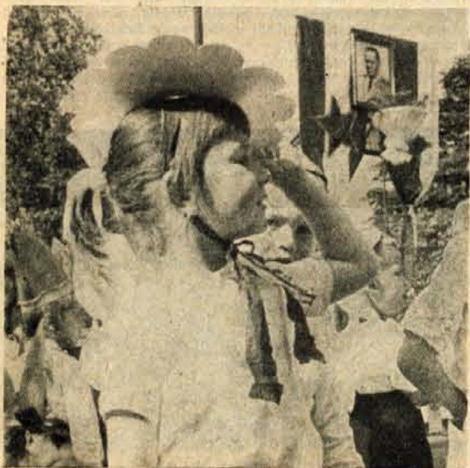
Dan mladosti so tudi malčki iz vrtca »Tugomir Vidmar« v Kranju lepo proslavili. Pred mamicami in drugim občinstvom so se pokazali kot jagode, murnčki, polčki in petelinčki. Tudi v narodnih nošah so se predstavili, lepo zapeli in zaplesali.