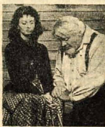
Fred Astaire, Ginger Rogers, Frank Sinatra in Doris Day — vsi ti so pričeli svojo kariero kot pevci popevk, a so kmalu prišli do zahtevnejših, resnejših vlog. Tudi Burl Ives (na sliki) je še pred nekaj leti pel v nočnih lokalih balade in narodne pesmi. Šele v zrelih letih je pričel nastopati v resnejših vlogah. Ze s svojo prvo večjo vlogo (igral je skupaj z Soño Loren) se je priril v prve vrste karakternih igralcev.