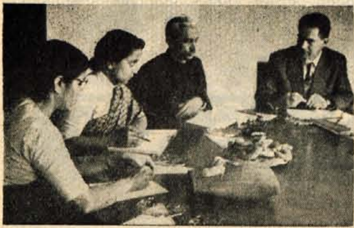
OBISK INDIJSKE DELEGACIJE V KRANJU

V petek, 29. maja je obiskala Kranj delegacija indijskega socialističnega gibanja »Sarvodaja«, ki je že dalj časa na obisku v Jugoslaviji.