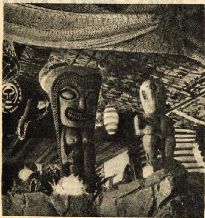
Restavracija švicarskega arhitekta predstavlja kombinacijo moderne arhitekture in tropske romantike in navdušuje slehernega obiskovalca. Na sliki vidite, da je bila arhitektova fantazija popolna. Celo havajske malike ni pozabil postaviti v prostor

Velika Britanija je na prvem mestu na svetu po številu prodanih časopisov. 575 prodanih časopisov pride na vsakih 1000 prebivalcev. Na drugem mestu je Švedska s 450 časopisi na 1000 prebivalcev, sledi Finska, Japonska, Norveška. Danska in ZDA s 350 do 400 časopisov na 1000 prebivalcev.