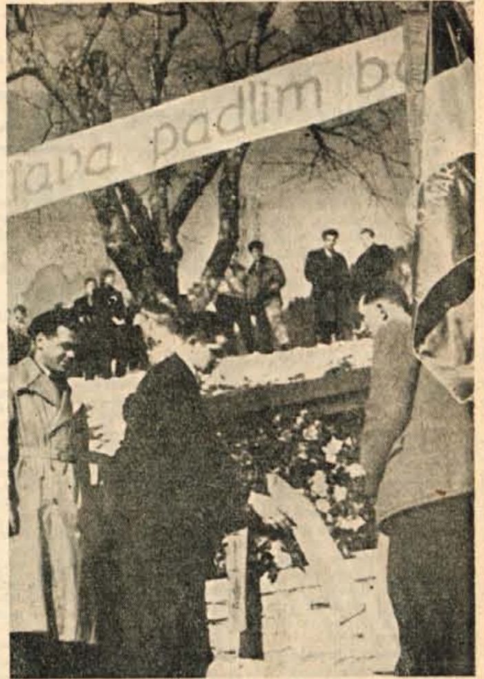
Pred spomenik v Dražgošah so položile mnogo vencev razne množične organizacije iz Zeleznikov, Medvod, Skofje Loke, Dražgoš in drugih krajev