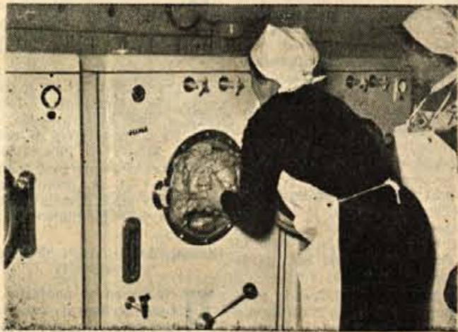
potem dvignile oprano, zlikano in bodo odprli javno pralnico tudi v naselju »Iskre«.

oddelki v zgornjih prostorih. Savskem bregu imata vedno več dela tudi pralnici na Zlatem polju in v Stražišču. V kratkem