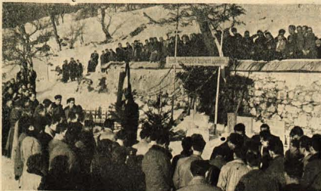
Padlim žrtvam v Dražgošah se je poklonilo veliko udeležencev