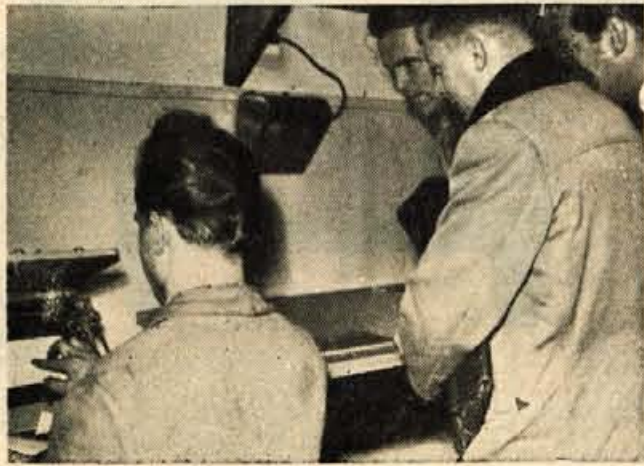
S pomočjo Gorenjske turistične zveze je časopisno podjetje »Gorenjski tisk« uredilo moderen laboratorij za črno-belo in barvno komercialno fotografijo. V laboratoriju bodo izdelovali predvsem razglednice gorenjskih turističnih krajev. V petek, dne 9. januarja so si laboratorij, pred začetkom rednega obratovanja, ogledali tudi člani Upravnega odbora Gorenjske turistične zveze.

cu. Investicijski program bo deloma krit s kreditom OLO