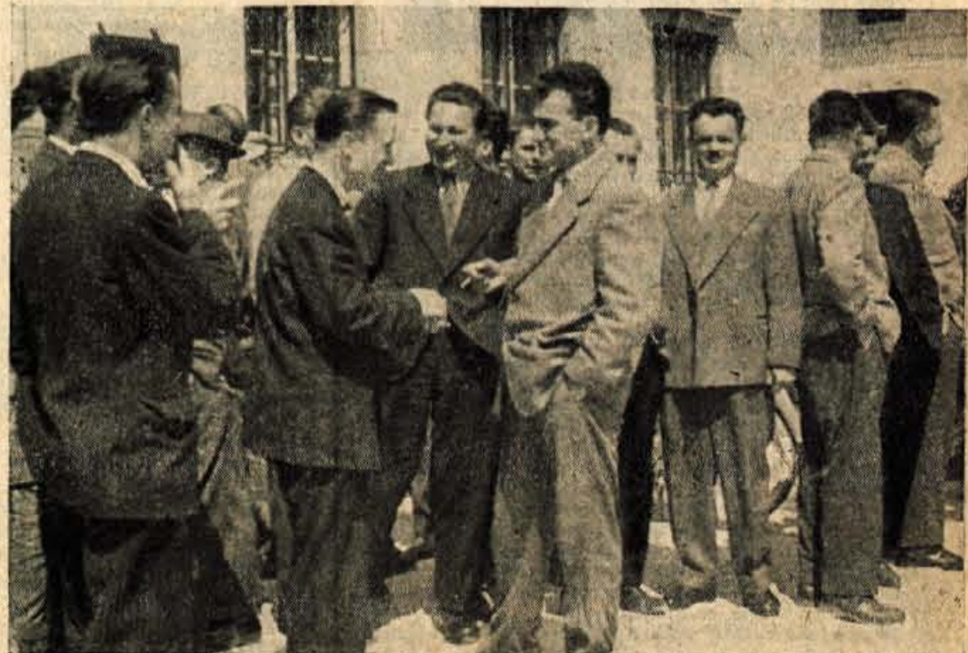
Delegati pred pričetkom občinske konference ZK v Radovljici

Cez nekaj dni bo Kranj oživel še bolj. Medtem ko so sedaj Kranjčani, predvsem mladina, v mrzličnih pripravah in je mesto polno velikih plakatov, bo te dni