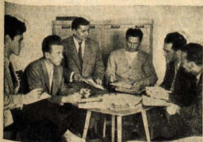
V prostorih OK LMS je zadnje dni nenavadno živahno. Člani pripravljalnega odbora imajo vsak čas posvete o pripravljanih detih

dobo. Nastaja novo rokometno igrišče, ki ga bo mladina zgradila z udarniškim delom; prva srečanja na njem bodo od 22. do 24. maja, ko bo v Kranju V. mladins-