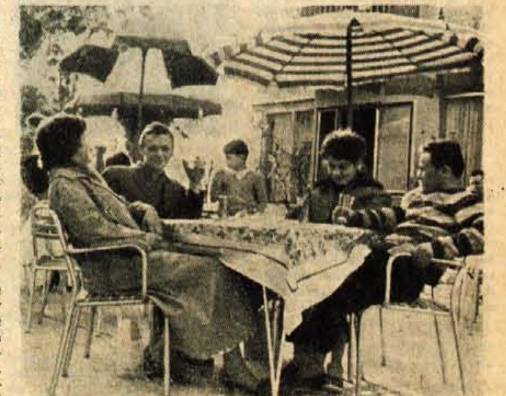
Toplejši dnevi že vabijo...

Vse to kaže, da imamo letos ugodne pogoje, da seznanimo mladino z osnovnimi pojmi, ki so potrebni za smotrno izbiro poklica, in da v skladu z družbenim planom za leto 1959 pričnemo z uspešnim vključevanjem vajencev v vse veje našega gospodarstva.