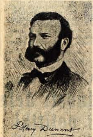
HENRI DUNANT ustanovitelj Rdečega križa

Jugoslovanski Rdeči križ je ko množična ljudska organizacija naslonil svoje delo na načelo najvišje humanosti, zato je med svoje najvažnejše naloge postavil boj za trajni mir na svetu, boj proti vsem, ki pripravljajo orožje za množično uničevanje civilnega prebivalstva, boj proti tistim, ki