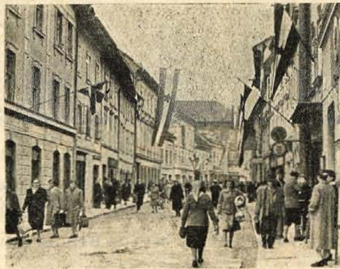
Kranj v prvomajski preobleki