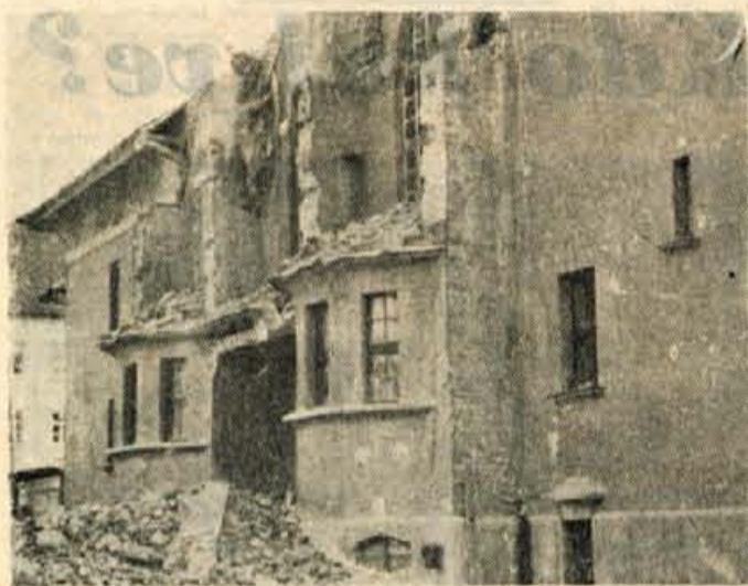
Sindikalni dom v Kranju med uređitvijo