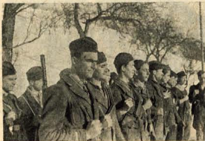
Slika št. 4. Vrsta mladih partizanov. Po nekaterih podatkih naj bi to bila štabna patrila Skofjeloškega odreda. Toda kje, kdaj je to bilo? Uganka menda ne bo težka, kajti slika je dokaj čista in jasna. Pišite na naslov: Muzej NOB, Kranj, Koroška 3.