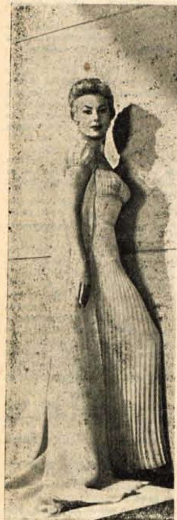
MITZI GAYNOR Ne le lepota, tudi izvrstna igralska sposobnost ji je pomagala uveljaviti se na filmskem platnu

»Zena, lepo te prosim, če še ne češ živeti z menoj, mi vsaj kuharico pustili.«