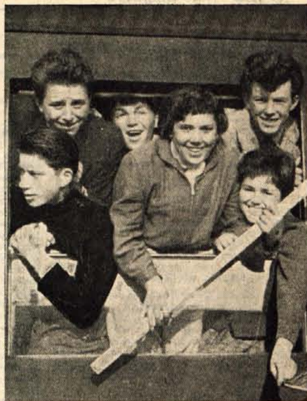
V petek zjutraj je odšla na gradnjo avtomobilske ceste »Bratstvo - enotnost« Paračin—Niš prva gorenjska mladinska delovna brigada »Staneta Žagarja«, ki šteje 120 brigadirjev. Mladinci in mladinke so ob odhodu vlaka z brigadirsko zastavo v roki in nasmejanih obrazov še zadnjič pomahali v pozdrav...