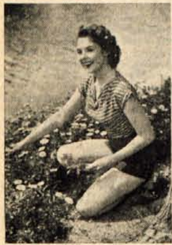
Napočila je pomlad in ameriška filmska igralka Mala Powers, ki jo zadnja leta v filmskem svetu zelo cenijo, trga prvi šopek pomladnega cvetja. - Marsikdo bi ji pomagal

Skoraj polovico vseh postelj v bolnišnicah zasedajo bolniki z duševnimi boleznimi — Danes je možno ozdraviti v 70 do 80% primerov duševno bolnih — Leto 1960 - svetovno leto duševnega zdravja