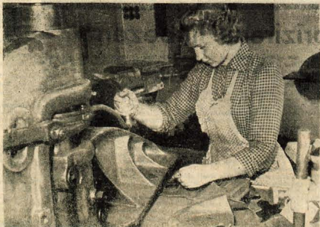
Na vsakem delovnem mestu v »Planiki« bodo letos, po novem tarifnem pravilniku, lahko dosti več zaslužili — seveda z delom po učinku

Kolektivom bodo pri izdelavi tarifnih pravilnikov pomagali predstavniki občine, zbora proizvajalcev in sindikatov. Namen te pomoči je v tem, da se ohranijo in še bolj razvijejo pobude in oblike, ki jih kolektivi odkrivajo in uveljavljajo ob pripravi sedanjih tarifnih pravilnikov, za čimbolj vzpodbudno nagrajevanje delavcev po učinku. Hkrati pa bodo morda prišle na dan še druge nepravilne težnje posameznikov, ki krnijo osnovni cilj — vzpodbudo delavcem za večji delovni zagon. K. M.