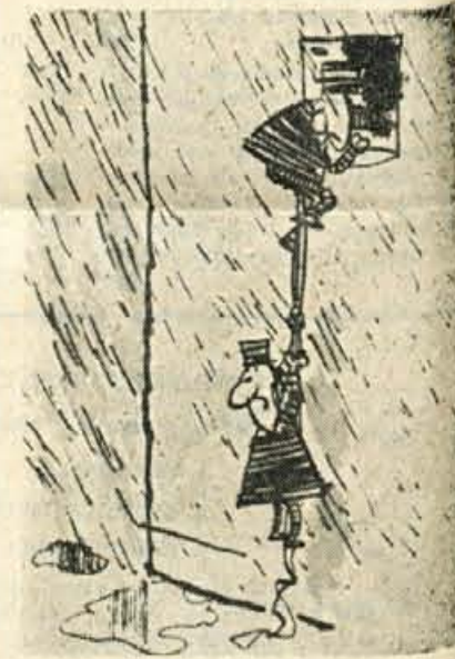
»Nazaj, kolega, dežuje... midva pa nimava dežnika!«