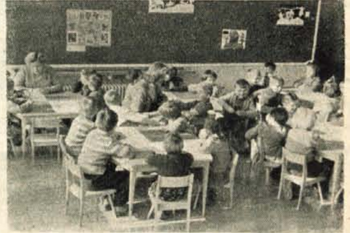
Varstvo otrok povzroča zaposlenim ženam največje težave

Razprava v glavnem ni potekala v smeri, ali naj se dopolnilni proračunski prispevek sprejme ali ne, ker so bili vsi soglasni, da občinski proračun te omejitve (39 milijonov dinarjev) ne more utrpeti; tudi zahteva, naj ta prispevek plačujejo vsi zaposleni (zakaj bi morali »davke« iz osebnega dohodka plačevati samo nekateri?) — tega se je spomnil le en odbornik — je v živahni razpravi naštel na gluha ušesa. Vrteli so se predvsem okoli vprašanja, ali naj 10% dopolnilni proračunski prispevek plačujejo iz delavčeve neto plače vsak mesec posebej ali naj ga v celoti plačajo ob koncu leta tako, da delavec tega ne bo neposredno občutil. Za železarno so izračunali, da vsak delavec plača dopolnilni proračunski prispevek le v višini 1,8% od svoje plače. Razprava se je končala brez kakršnegakoli sklepa, češ da o tem nima smisla govoriti.