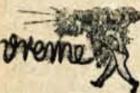
Lepo vreme; sprva slana, kasneje topla.

IZDAJA ČP »GORENJSKI TISK« - UREJUJE UREDNIŠKI ODBOR - DIREKTOR IN ODGOVORNI UREDNIK SLAVKO BEZNIK - TELEFON UREDNIŠTVA ST. 475 - UPRAVA ST. 397 TEKOČI RAČUN PRI KOMUNALNI BANKI V KRANJU 607-70-1-135 - IZHAJA OB PONEDELJKIH IN PETKIH - LETNA NAROČNINA 600 DINARJEV, MESEČNA NAROČNINA 50 DINARJEV