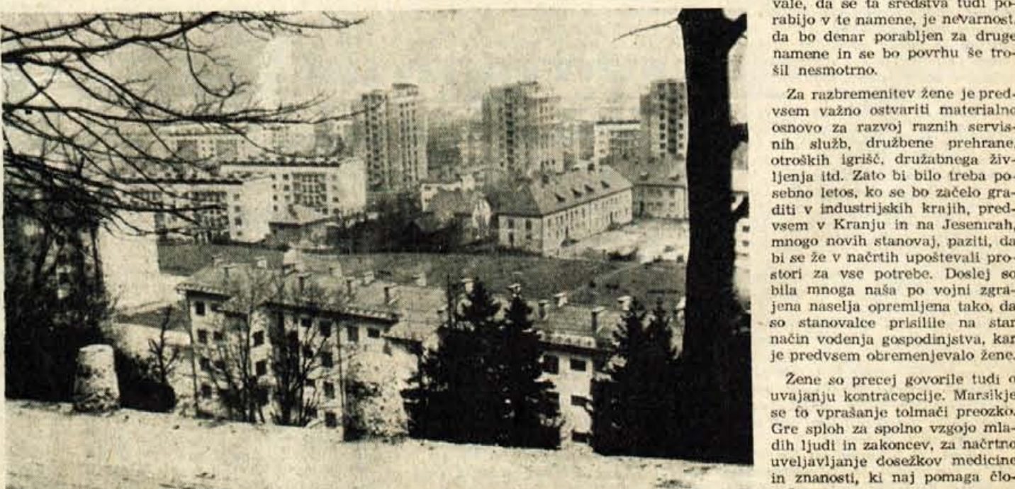
JESENICE SPREMINJAJO SVOJO PODOBO

Ze lani se je pokazal precejšen napredek v kmetijstvu, letos pa je predvideno nadaljnje povečanje kmetijske proizvodnje za 10% in to s povečanjem hektarskega donosa v kooperacijski proizvodnji, melioracijo 63 ha srenjskih blat, deset odstotnim povečanjem travniških površin na račun žitaric itd. Važno vlogo bo odigrala tudi rajonizacija planin. Omenjene so tudi investicije za adaptacijo mlekarne Stara Fužina in preureditev mlekarne Bohinjska Bistrica, ki bo proizvajala več vrst mlečnih izdelkov. (Nadaljevanje na 2. strani)