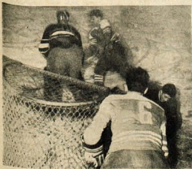
Na umetnem drsališču pod Mežakljo je bila v četrtek svečana otvoritev III. mednarodnih metalurških športnih iger na Jesenicah (poročilo berite na 5. strani)

Kot je znano, sta bili na Jesenicah minulo jesen ustanovljeni dve stanovanjski skupnosti. Toda samo ustanovljeni. Od takrat pa do danes pa se stvar ni premaknila z mrtve točke. Lepo in skrbno pripravljene načrte so običajni nekje v predalih. Kaže, da se podjetja in tudi občina, niso dovolj zavzela za razvoj stanovanjskih skupnosti. Drobnob obrtne in komunalne uslugе pa kot problemi vsak dan bolj kriče po rešitvi. Saj vseh niti ne kaže naštevati. Na Jesenicah je 4.260 gospodinjstev, kopalnic pa jih ima le 684. Res je, da se mnogi okopajo v tovarni, toda za večino je to problem.