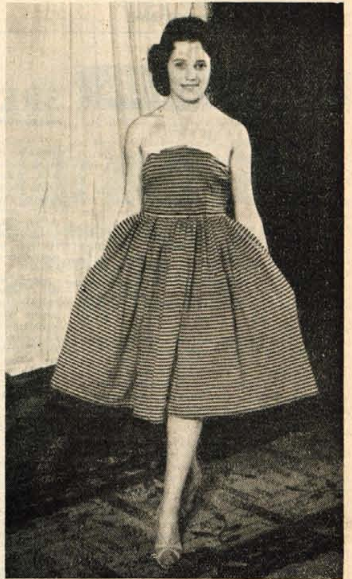
Minuli četrtek je tovarna nogavic in platenin »ALMIRA« iz Radovljice, presenetila Radovljičane in okoličane z modno revijo. Na reviji so prikupne manikenke — po večini delavke v »Almiri« — prikazale kolekcijo modnih oblačil, ki jih podjetje pripravlja za pomlad in poletje. Revija je dobro uspela. Kaže, da bi tak stik s potrošniki morala poiskati tudi druga tovrstna podjetja