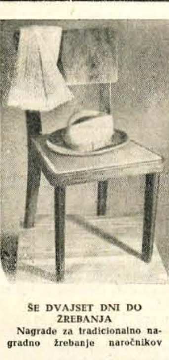
SE DVAJSET DNI DO ZREBANJA Nagrade za tradicionalno nagradno žrebanje naročnikov