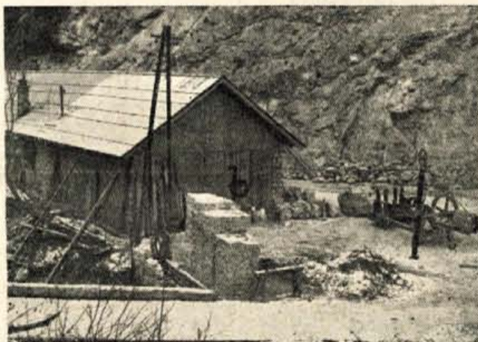
Kamnolom — nova veja gospodarstva na Jezerkem

pojme seveda — ko se je leta 1856 začela trgovina z merkantilnim lesom in ko je stekla železnica med Ljubljano in Trstom.