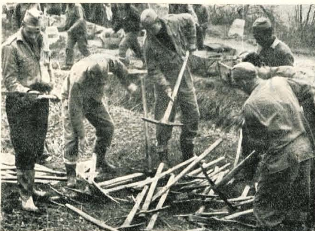
Gradnje avtomobilske ceste se je udeležilo 151 mladincev iz kranjske občine