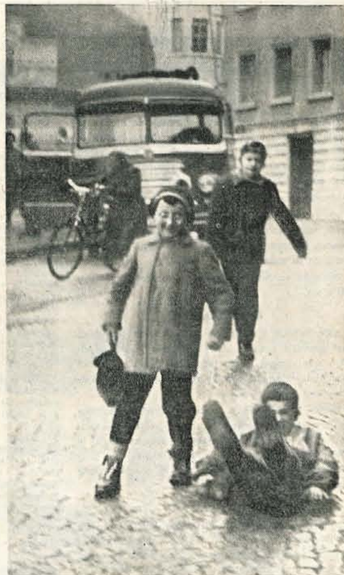
Preklicana poledica! Pa je le zabavno, že te takole na lepem spodnese

delavnicah srednjih in nižjih strokovnih šol, ki dijakom nudijo možnost za praktično uveljavljanje svojega znanja, za razpravljanje o pomembnih vprašanih kolektivna, in so nekakšna šola za kasnejše delo mladih v organih samoupravljanja. Razprava na konferenci je bila zelo dobra, vprašanje pa je, koliko bo prispevala k izboljšanju dela mladinske organizacije v prihodnjem letu. Razen slabe udeležbe je namreč treba grajati zlasti to, da mladi niso nastopili z jasno izdelanim programom dela za prihodnje leto, brez česar si je težko zamisliti uspešno delo. Bati se je, da bodo sklepi, ki jih bo še formirala posebna komisija, ostali samo sklepi na papirju, kar pri dosedanjem delu ni bilo ravno redkost.