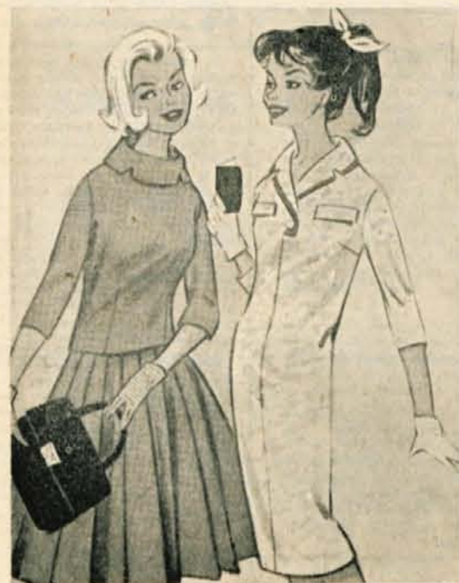
Dve praznični obleki za mlade deklice, ki bi bile rade nove

Pri umazanem gospodinjstvem delu, posebno če imamo opravka z ostrimi kemikalijami, zaščitimo roke z gumastimi rokavicami. Da jih laže nataknemo, jih znotraj posujemo s smukcem. Po končanem delu jih obistimo še na rokavah: najprej jih dobro namilimo, nato pa speremo. Snemamo jih previdno in posušimo znotraj in zunaj. Suhe nasujemo s smukcem in shranimo zavite v čisto krpo na suhem in hladnem kraju.