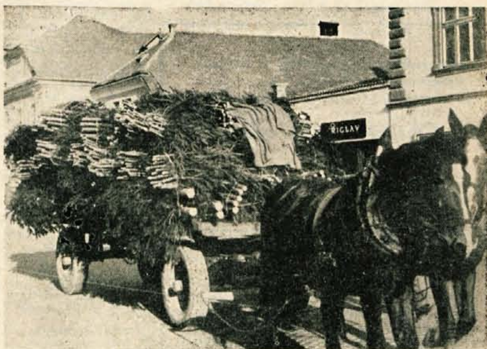
Bo letos na trgu dovolj jelk pred Novim letom? Upajmo, da jih bo in da posameznikom ne bo treba delati škode po gozdovih

Naročajte knjige knjižne zbirke Prešernove družbe