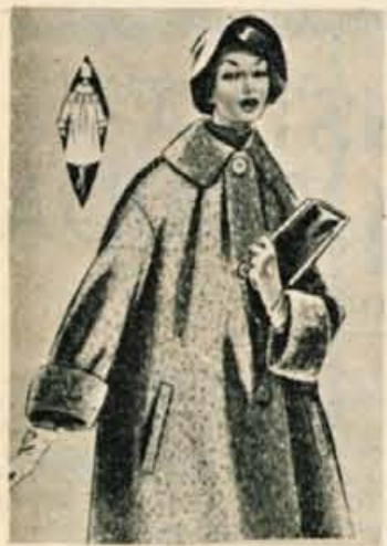
Visoko zapet plašč z velikim ovratnikom po vzorcu trapeza