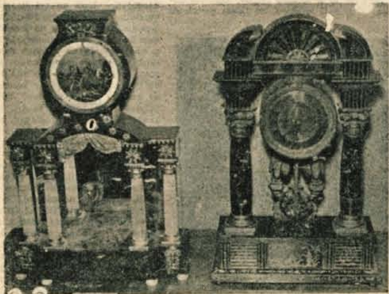
Dve dragoceni uri. Na levi ura s stebrički iz alabastra (iz srede 19. stoletja), na desni klasična ura iz prve polovice 19. stoletja

V Prešernovi hiši v Kranju te dni razstavljajo zbirko ur iz depojev Mestnega muzeja. To so stare, na vse mogoče načine oblikovane ure, vse iz okolice Kranja. Med njimi so take na visokih podstavkih, potem ure s posebnim mehanizmom, nekakšni primitivni gramofoni, s celo zbirko »plošč«, ki nam pričarajo najrazličnejšo glasbo, če jih navijemo, pa »kukavice«, ki še danes krasijo marsikatero kmečko hišo na Gorenjskem lld.