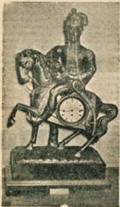
Stoječa ura s konjenikom iz Kranja (iz srede 19. stoletja)