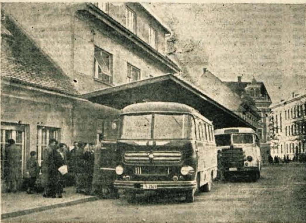
Končno je Kranj dobil primerno avtobusno postajo, katere otvoritev je bila ob Dnevu republike