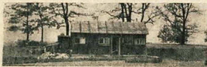
Brez gradbenega dovoljenja je na nezazidljivem okolišju na podjetjem TIO v Lescah zrastle prijeten dom. Ali bo dom ostal prijeten ali ne, še ni moč reči!

Toda mojster je vztrajno nadaljeval. Gradbeno dovoljenje je že