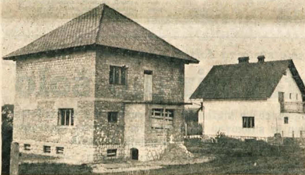
Sele četrta štirikapnica je dvignila prah v Lescah. Kako to, da ga prejše tri niso?

In s kopanjem je nadaljeval. Precej široko površino ruš je že odmetal in tudi nekaj zemlje. Sosed se je spet pritožil. Zagovor mojstra je bil: pot si delam. In nadaljeval je. Izkopal je že precej globoko in široko. Spet se je moral zagovarjati — premisli sem si, gramoznico delam. Tudi to so mu