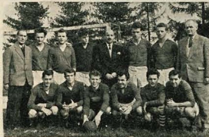
Jesenski prvaki Gorenjske so Ločane