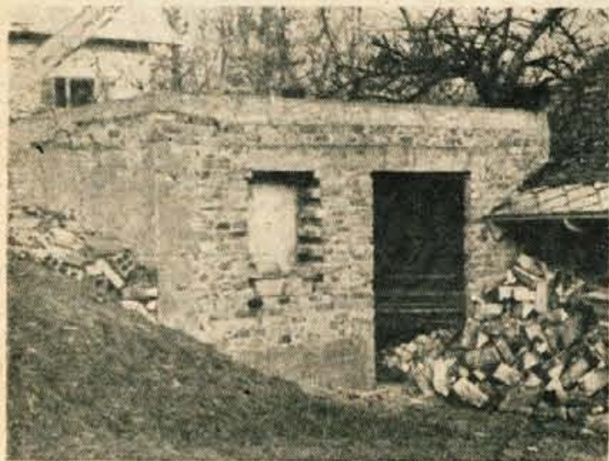
V Hlebcah pri Begunjah je kmet začel z gradnjo gospodarskega poslopja brez dovoljenja. Kakšen bo konec »afere«? Sodnik za prekrške se ni odločil.

bilo to podjetje preveč obširno, smo ga že razdelili v manjše oddelke — gradnjo po komunah. — Le-te imajo svoje referente za gradnjo (vsaj morale bi jih imeti), gradbene inšpekcije, urbanistične načrte in vse potrebno, kljub temu pa so še vedno pogosti pojavi divjih gradenj. Kdo je kriv temu? Predvsem tisti, ki ne upoštevajo predpisov in gradijo brez gradbenih dovoljenj in tudi tisti, ki bi morali gradbeno dovoljenje zagotoviti pravočasno!