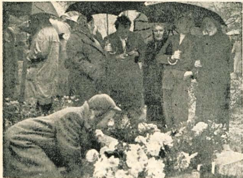
Bele krizanteme za očetov grob

Sila neresno jemljejo v nekaterih zadrugah tudi odpravo nekmetijskih dejavnosti in združevanje gospodarsko šibkejših zadrug. V Zirovnici so se na primer kmetje odločno uprli priti na občni zbor, če bi tam obravnavali odcepitve trgovine. Pri združevanju je bilo skoraj povsod opaziti ozke lokalistične težnje nekaterih zadrugnikov — tudi članov upravnih odborov — niso se pa zavedali, da bo uveljavljanje nove vsebine dela uspešno le v tistih zadrugah, ki bodo imele dobro gospodarsko osnovo, pa tudi združna sveta ne morejo voliti, če imajo manj kot 100 članov. Važno in nujno je, da se zdaj razčisti in oceni razvoj vsake zadruge, da jih pozneje ne bo treba več združevati in drobiti, ampak samo še utrjevati za neposredne naloge.