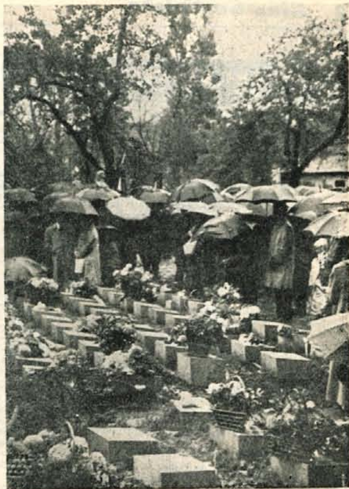
Z ŽALNE KOMEMORACIJE V BEGUNJAH Kljub dežju je mnogo ljudi počastilo spomin zverinsko pobitih talcev