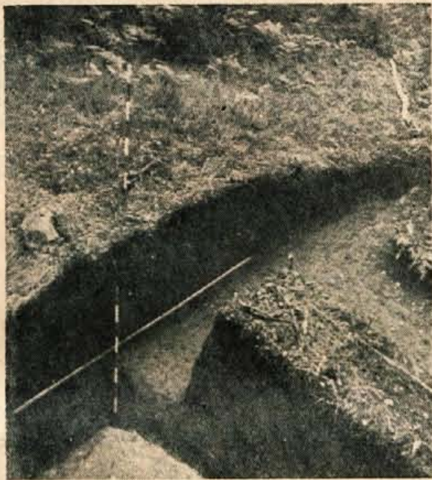
Taka je gomila potem, ko jo arheologi odpro