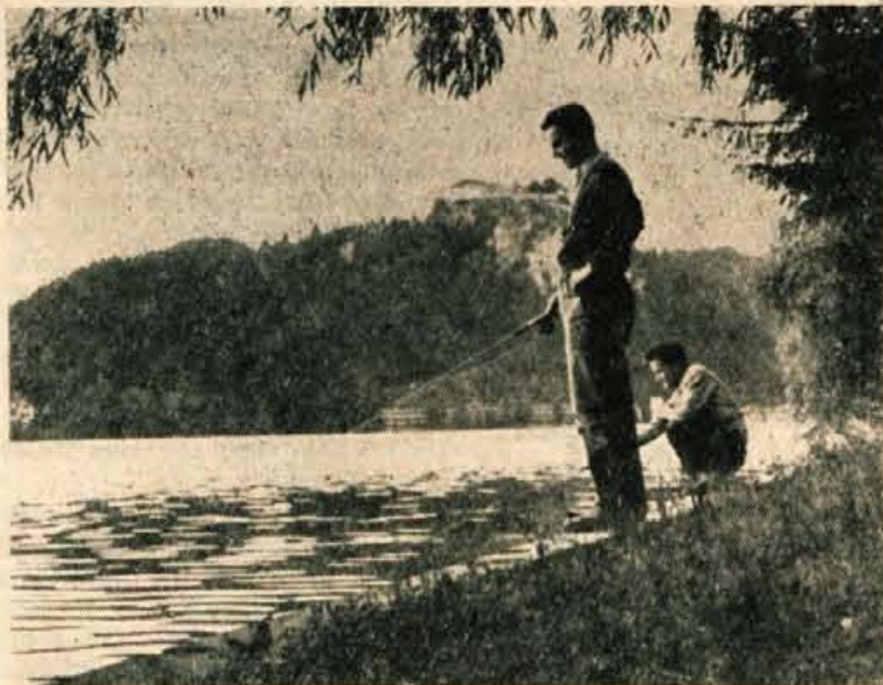
Jesenski motiv z Bleda: RIBIČI OB JEZERU

V razpravi je bila med drugim izrečena misel, da bo spričo velikega obsega gradbenih del investicijski program težko izvesti, ker Gradbeno podjetje in domači obrtniki ne bodo kos vsem delom. Zato se spet lahko zgodi, da se bodo obnovitvena dela preveč zavlekla. — Vse pozornosti je vreden predlog, da bi bilo potrebno za glavno sezono, zlasti pa v času večjih prireditev, zagotoviti določeno število rezervnega trgovskega in gostinskega strežnega osebja. Prav tako bi bilo nujno nabaviti potujoče stojnice, saj je veliko raznih prireditev med sezono v okolici Bleda: v Zaki, na Straži, v kopališču itd. Z rednim trgovskim in gostinskim osebjem večjih strežb v času prireditev ni mogoče izvesti, saj ga še za trgovine s celodnevним obratovanjem ni dovolj. J. B.