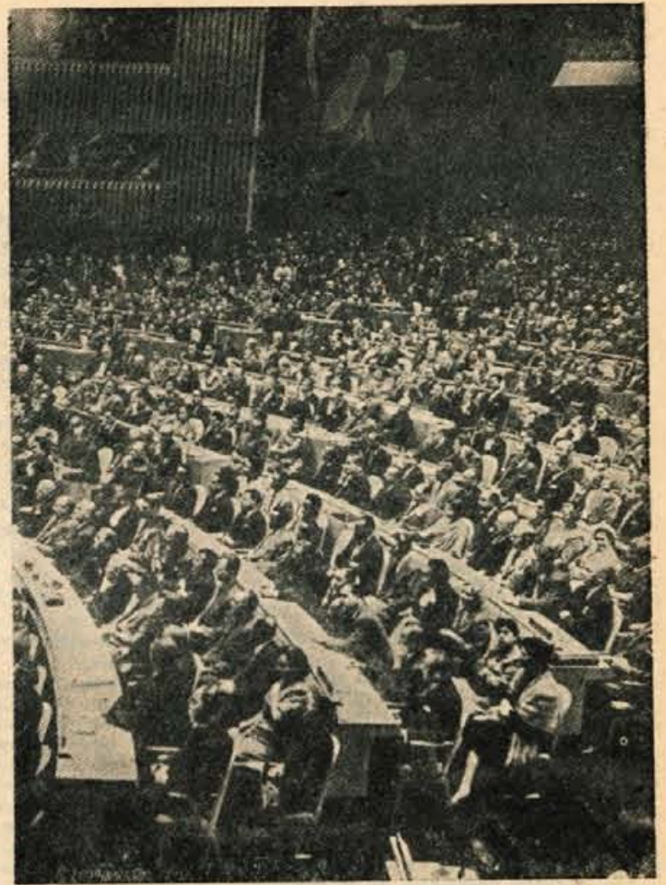
GENERALNA SKUPŠČINA ZDRUŽENIH NARODOV SE BO 31. OKTOBRA SPET SEŠTALA NAJPOMEMBNEJŠA RAZPRAVA BO TOKRAT VPRAŠANJE RAZOROŽITVE.