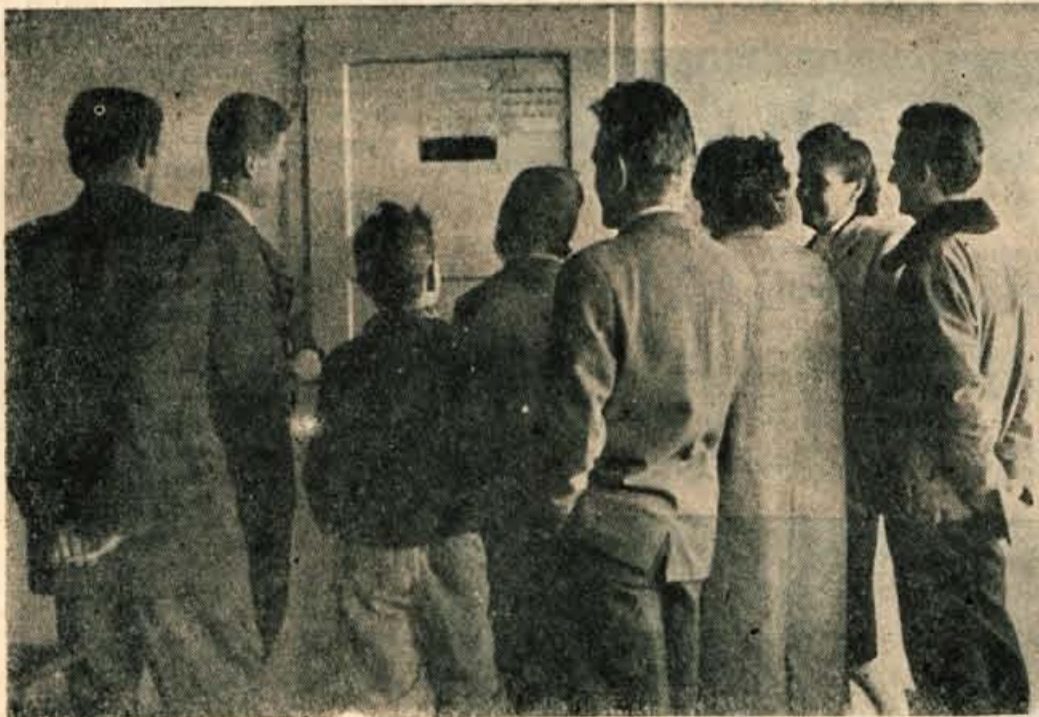
V ČAKALNICI V ZDRAVSTVENEM DOMU

borniki o vprašanjih zdravstva govorili tudi zdravniki, predstavniki zdravstvenih organizacij in ustanov in drugi.