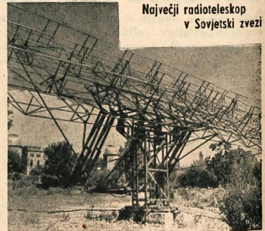
Blizu Blurakana v Armeniji so za delo tamkajšnjega astrofizikalnega observatorija zgradili največji radioteleskop v Sovjetski zvezi. Napravo, ki je 1700 metrov nad morskoo gladino, kaže naša slika

Fizikalne lastnosti snega se s temperaturo precej spremenijo. Opazujemo lahko, da sneg v različnih temperaturah ne »poje« vedno enako, če hodimo po njem. Če