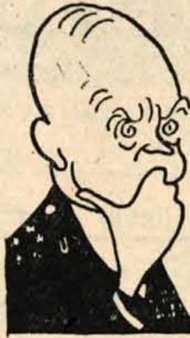
misleke in zdaj pred volitvami gotovo tehta, kam bo dal svoj glas.

Za mir in pomiritev so ameriški volivci izredno občutljivi, zato bi vsaj del njih resnično mrlotubni podvojili zlahka spet obrnili na republikansko stran. Vkljub vsemu na ta vorašanja ne bodo odločila o volilnih rezultatih na novembrskih volitvah Zadnje besedo bodo prve s svojimi neomajnjenimi sredstvi imeli krogi, ki že toliko časa vodilo in oblačilo na ameriških političnih hobzorih — to so eksponirani velikega kapitala in zastopniki monopolov in kartelov.