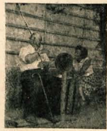
Maroltov oče iz Podhoma pripoveduje

judi, ki so bili počaščeni, če so lahko hvalili »dobre stare čase« in so radi obujali spomine ter pripovedovali o njih. Mi pa smo pridno pisali, saj se pisana beseda dlje uhani in tako marsikateri reč ne uide izgubi. Tudi stare hiše z lesenimi hodniki in kamnitimi veznimi podboji, male lesene kočice z lesenim stropom, »erne kuhne«, starinske kašče, svišli, različne kozolce itd.