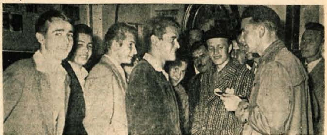
»Radi bi šli v kino, pa smo ostali brez kart, čeprav je kavbojka »Štirje jahači«. Drugo zabavo v Tržiču ni. Kam naj gremo?« se petočlani našemu sodelavcu

Edin razveseljiv pogled je bil v majhen prostor šahistov. Nad 30 mladincev se je zabavalo ob beločrnih šahovnicah. Ko pa je bila ura 21., so tudi tu ugasnile svetilke.