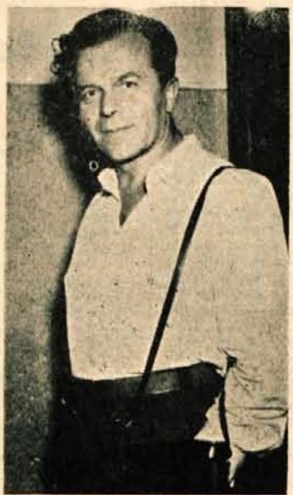
ko, sem sem pa tja zbral še kakšne dinarje in sem začel poskušati s fotogra-

80 dinarjev. Kljub temu pa je bila za mene precejšnja dragocenost. Čeprav tež-