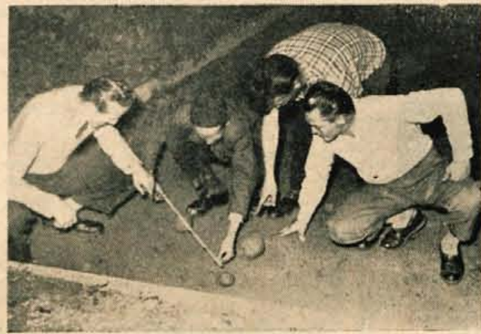
Na igrišču pri gostilni »Javornik« v Sp. Lomu balinajo tudi ko je že tema. Mladim ljudem je vsaka zabava dobrodošla...

iznajdljivost vedno lahko pozitivna? Vsekakor ni. Dokaz: sobota zvečer in polletni obratun gostincev!