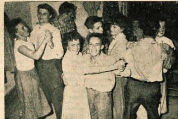
Kako si Tržičani žele plesati, toda plesa ni nikjer! Kolektiv prirezovalnice podjetja Peko si je sam priredil zabavo v gostilni »Javornik«. Zadovoljstvo mladih delavcev je bilo nepopisno

Pred kinom je ostala vrsta »nesrečnežev« brez kart. Kam naj