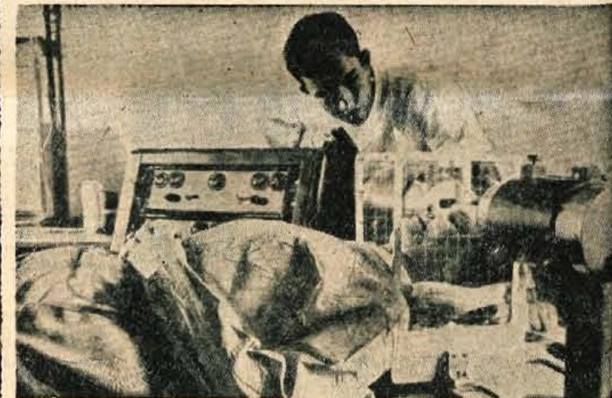
Aparat za odkrivanje tumorjev s pomočjo radioaktivnih snovi. Za ta proces uporabljajo izotope bakra in arzena.

Nošenje tesne obutve ne samo da povzroča močne bolečine, ampak tudi razne žulje in je celo vzrok za izkrivljenje hrbtenice in za črevesne motnje. Tudi glavobol je nemalokrat posledica nošenja preveč tesnih čevljev. Več zdravnikov je to potrdilo s tem, da jim je uspelo ozdraviti uporne migrene enostavno na ta način, da so svojim pacientom priporočili izmenjavo obutve kot edino zdravlilo.