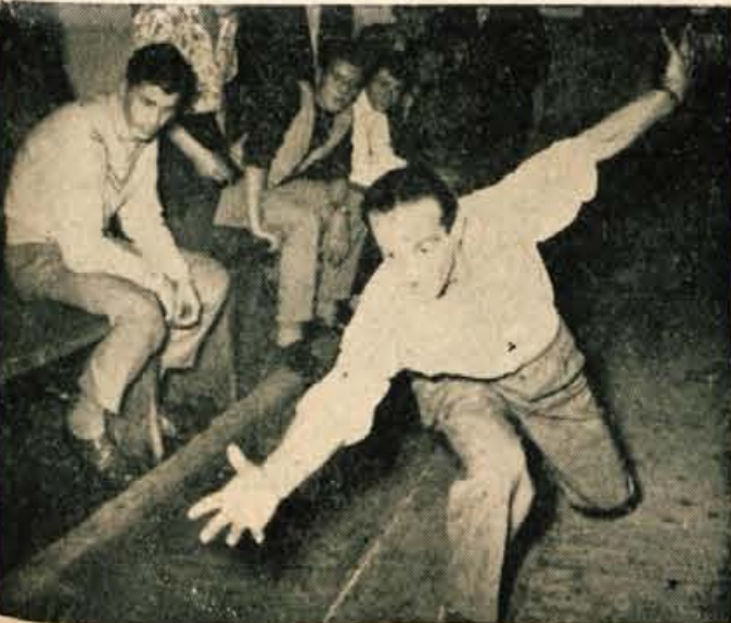
Enostezno kegljišče v Tržiču je pretesno. Ljubitelji tega športa se ne morejo več zvrstiti.

In končno, kakor koli že, dosedanjega zapravljjanja prostega časa v Tržiču mora biti konec. Družabno življenje je družbeni problem, zato se moramo resneje lotiti tega vprašanja. Če bo tako, uspeh ne bo izostal. Tržičani si bodo takrat lahko skovali še lepšo pesem kot so si jo že, ki pa si je danes nihče več ne upa zapeti. FaBo