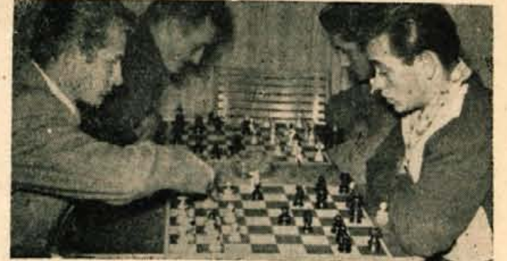
Tržička mladina se za šah na Gorenjskem prav gotovo najbolj zanima. Žal pa ni nikogar, ki bi to mladino v šahu izpopolnjeval — prepuščena je sama sebi