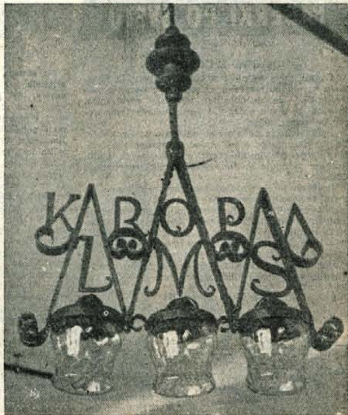
Danes, v ponedeljek, se je začel v Beogradu VI. kongres Ljudske mladine Jugoslavije. Kongresa se bo udeležilo tudi 10 delegatov gorenjske mladine. V Beograd so te dni prišle nekatere mladinske delegacije tujih držav.

Osnovna organizacija LMS tovarne -UKO- in -Plamen- v Kropi sta pripravila za VI. kongres jugoslovanske mladine lepo darilo, ki ga vidite na sliki.