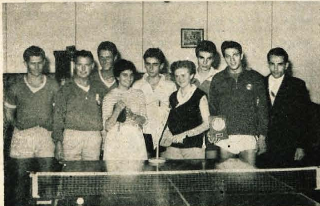
Igralci z zadnjega mednarodnega srečanja Jesenice : Ollmpyja, Padova (Italija)

»Nikakor ne moremo priti na zeleno vejo. Najboljši igralci odpadajo drug za drugim. Vzroki so različni in v večini opravičljivi. Vsekakor pa je naša prihodnost perspektivnejša. Naraščaja imamo