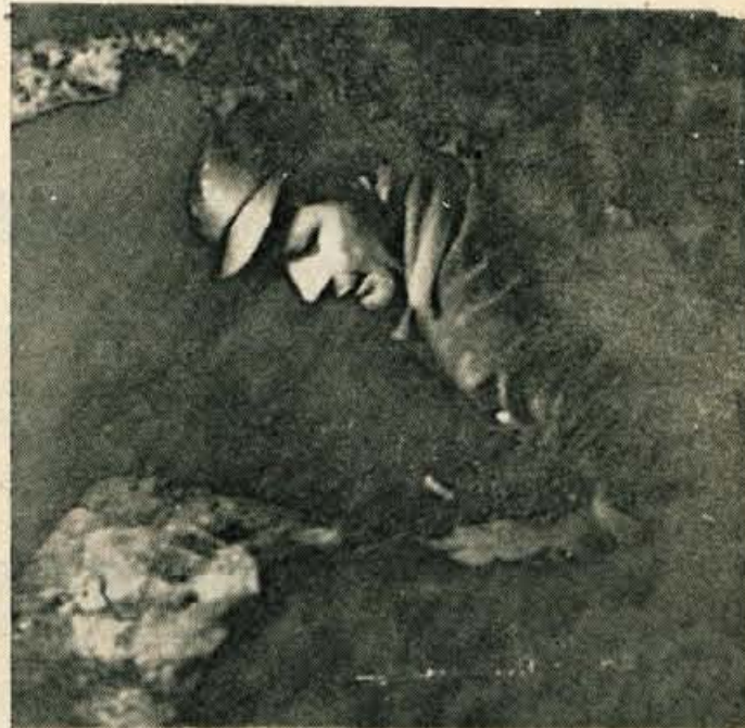
Tudi takole smo se prebijali skoz tesne prehode Arnešove luknje

Prešerna volja nam je drugovala, ko smo na debelo pomazani z ilovico hiteli proti našemu oporišču — Arhovi kmetiji. Po kratkem počitku smo se znova odpravili na pot. Pred nami je bil drugi del naloge — Arnešova luknja. Nekaj časa smo jo mahali po gozdnem parobku, nato smo morali do cilja skozi Sp. Duplje. Ljudje so se začudeni ozirali za »ilovnato« trojko.