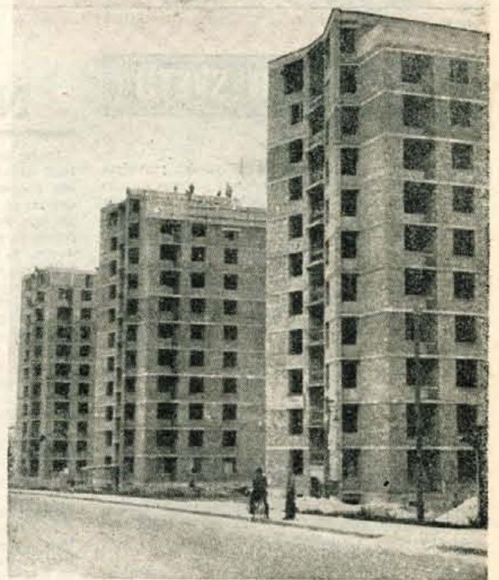
TRJE JESENISKI NEBOTIČNIKI Tri štirideset stanovanjske stolpnice na Jesenicah so že pod streho

Ugotovitev komunistov v Železarni Jesenice