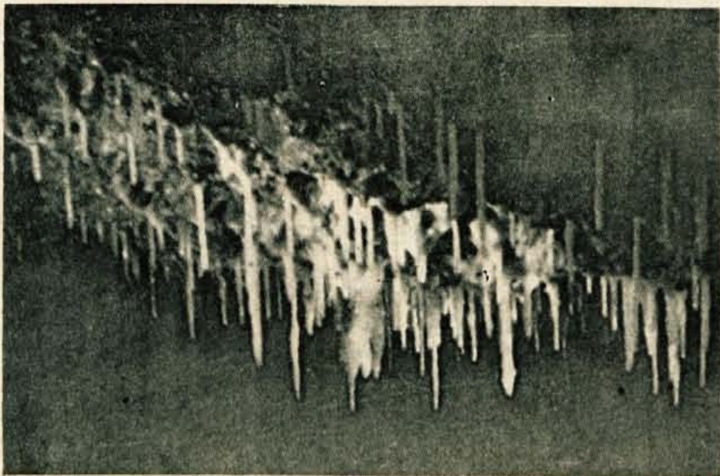
Ob koncu Dacarjevega brezna naletiš na množico kapnikov, ki više s stroga kot grozdje