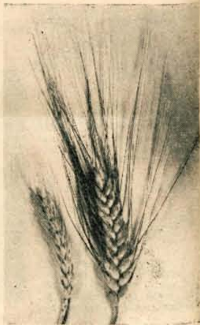
Primerjajte klas ruske pšenice z našo domačo pšenico. Razlika je precejšnja.