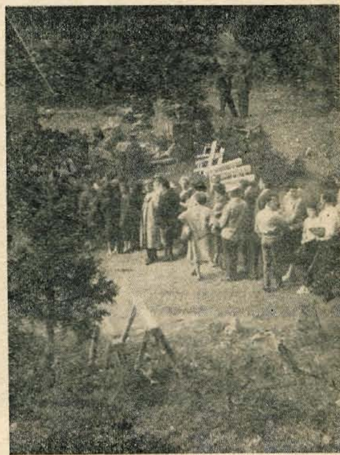
Kdo je kriv takšni vrsti in tolikšnemu čakanju, ko hočeš ob nedeljah spet v dolino? »Planinci« sami, saj vsi hočejo čim dlje ostati na vrhu Krvavca, potem pa se nepravilno pritožujejo nad organizacijo prevoza. Kdor prej pride, prej melje, pravi pregovor. Na Krvavcu pa bi bilo prav, da bi tisti, ki prej pridejo, tudi prej sli — in čakanju bi bilo konec.

Vetina obiskovalcev najprej zavije v »Kočo ob žičnici«. Silce žganja nikakor ne more škoditi. Nato pa naprej proti »Domu na Krvavcu«. Ze od daleč je slišati godce. »Harmonika na »knofe« je res neumljiva. In če se ena le preveč ogreje, je že