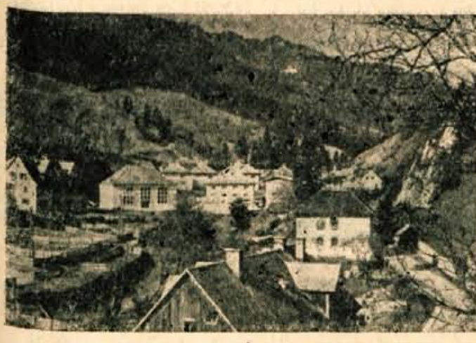
Na fabriki v Trziču raste novo naselje