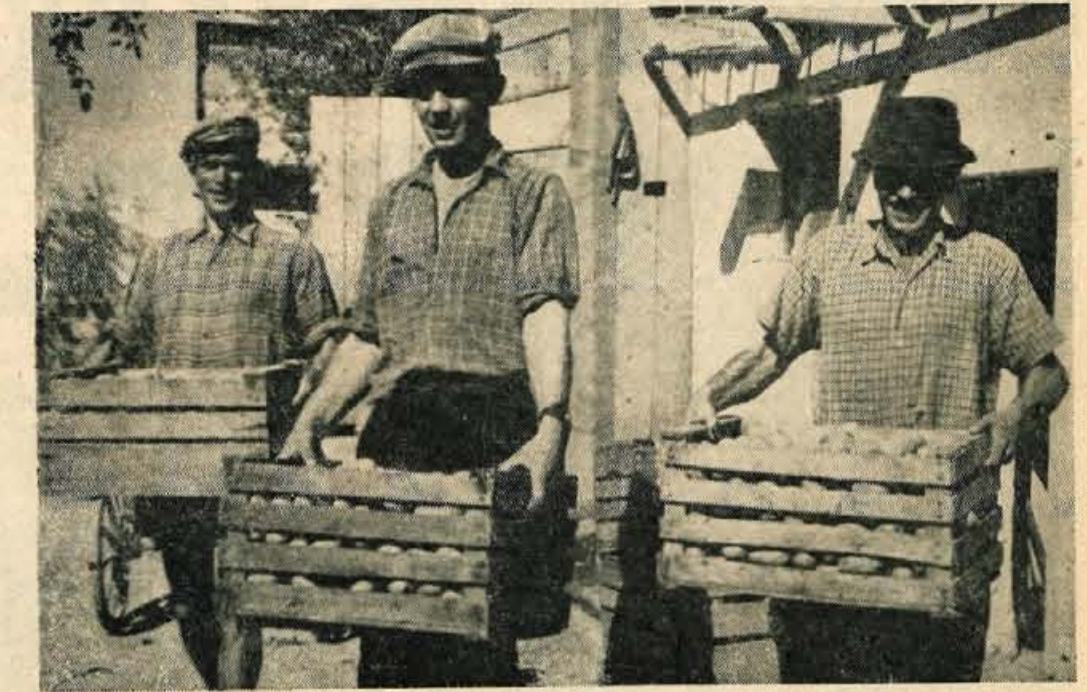
To so tri krepke kmečke korenine iz hribovske vasice Gozd na Kriški gori

»Od sodelovanja z zadrugo pričakujem predvsem zvišanje pridelka, povečanje hektarskega dono-