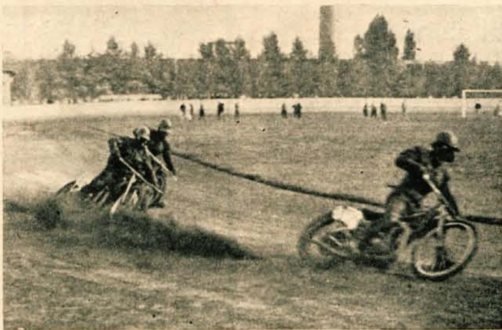
POLJAKI SO ŽE V KRANJU

Da bi ublažili pomanjkanje prenočišč, so lani določili precej sredstev za opremo privatnih turističnih sob. Običali pa so pred (Nadaljevanje na 3. strani)