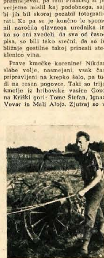
Predsednik kmetijske zadruge v Cerkljah orje krompir