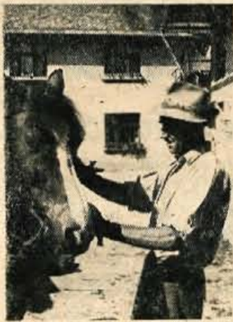
Kvanšek oče naprega konje

jala sva se tudi z nekaterimi upravniki kmetijskih zadrug. Jasno, to je šele začetek in ni čudno, če so nekateri še v skrbeh, kakšen bo uspeh. Prvi uspehi pa so že tu!