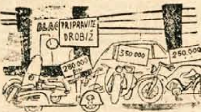
Brez besed (Iz Del. enotnosti)