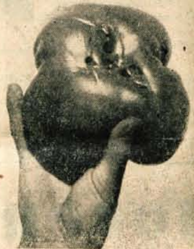
GOLIJAT MED PARADIŽNIKI Priznajte, da je paradiznik na sliki pravcati Golijat v primerjavi z ostalimi tovrstnimi plodovi. Zrasel je na kmetijskem posestvu »Sorško polje« v Bitnjem pri Kranju. Plod je rožnate barve in tehta 1,20 kg. Posebnost te sorte paradiznikov je, da so zelo obilni in ne spremane barve niti tedaj, ko dozore.

Dokaj vljudno mi je odgovoril, da še noben nameščenec ni prišel v službo in mi ponudil stol, da bi počakal. Po enournem čakanju je prišel elegantno oblečen mož, kateremu sem ponovil svojo prošnjo in rekel, da pripadam nemški obveščevalni službi. Dal mi je naslov v rua Borges Caniera. Ko sem prispel tja in stopil v eno izmed hiš, me je na pragu čakal postaven Nemec z brazgotino na obrazu. Torej je nekdo že telefoniral iz veleposlaništva.