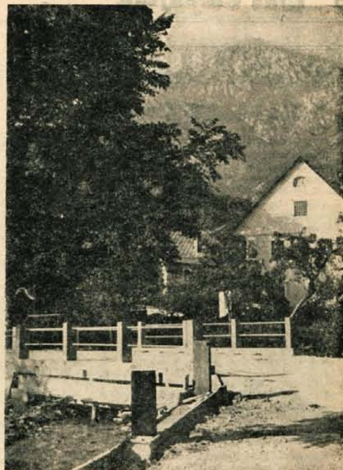
Slikovita je vasica Bašelj pod Storžičem. Vaščani so letos čez potok, ki teče skozi vas, zgradili nov most