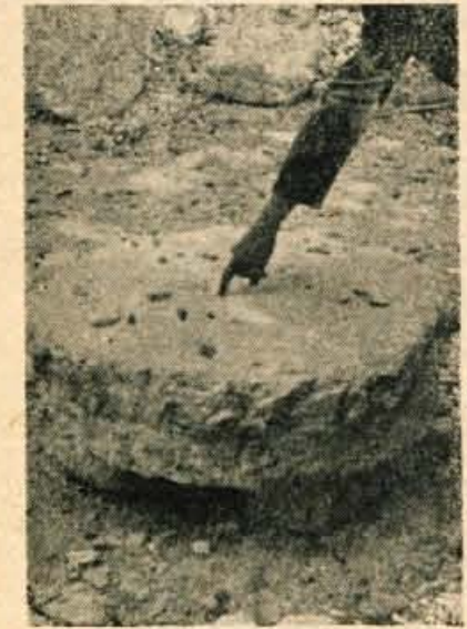
Na pol izdelan kamen, odlučen od matične kamenine, je treba še dokončno obdelati. Roka kaže mesto, kjer bo treba še izklesati luknjo

obsegu. Konglomerat je tu trdno zlepjen in treba je precej truda, da mišičaste roke delavcev izluščijo iz zemlje lepo oblikovan mlinski kamen. V jami, kjer delajo, vidimo iz konglomerata izklesane okrogle bloke, ki so spodaj še spojeni s podlago. S počasnim in previdnim zabijanjem različnih dlet pod kamen jih skušajo odluščiti od matične kamenine. Zgodi se, da pri tem kamen počni in je ves trud zaman. To pa se izurjenim delavcem ne zgodi pogosto. Na odluščenem kamnu je potrebna še dokončna fina obdelava in kamen je pripravljen za mletje. En kamen zahteva od delavca kakih 6 dni trdega dela. Seveda pa je te odvisno od velikosti kamna in kakovosti materiala.