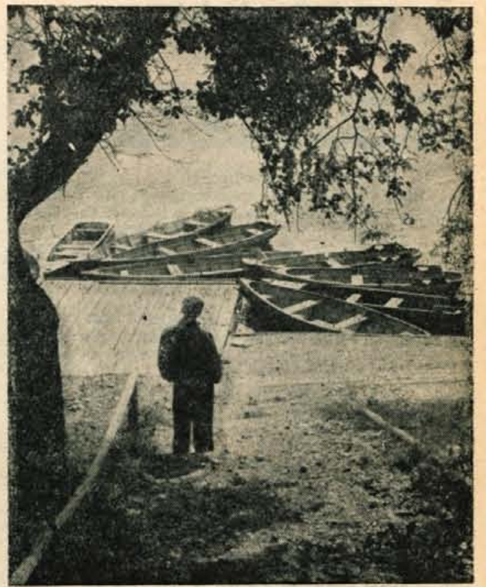
Poletna sezona se je poslovila. Na Zbiljsko jezero sta legla mir in hlad. Le ob sončnih nedeljah, in te na srečo niso tako redke, je na bregovih jezera, pa tudi na jezeru živahnejše kot sicer. Med tednom pa je največkrat tako, kot kaže naša slika. Zdaj zdaj bodo zavele z gora mrzle jesenske sapa...