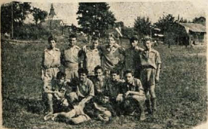
Mladinsko nogometno moštvo »Prešeren« iz leta 1957, od katerega je ostalo le še nekaj igralcev, ki sedaj nastopajo v dresu prvega moštva

brez igrišča in opreme. Toda resenje je zmagalo. Čeprav je bilo nogometašev le za eno moštvo, so si takoj s prostovoljnim delom uredili igrišče, nabavili opremo in še isto leto tekmovali za naslov gorenjskega prvaka. Seveda o kakšnem večjem uspehu prvo leto ne moremo govoriti. Pomembno pa je to, da so prebili led, kot pravimo. Dugo leto po ustanovitvi je klub nastopal že s tremi moštvi v Gorenjski nogometni podzvezi: pionirji, mladinci in člani. Vsa moštva so odšle tekmovala z večjimi ali manjšimi uspehi. Vsekakor pa je bilo v prvih letih najuspešnejše A moštvo, ki je bilo v gorenjski ligi vedno v »zlati sredini«, eno leto pa je tekmovalo tudi v takratni II. slovenski ligi. Prav