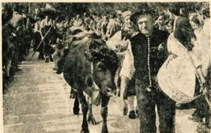
Majerji so prignali čredo v dolino

ne plesne in pesmi, je v domovini in na tujem iz leta v leto več zanimanja. Trenutno se v Bohinju mudi ekipa Dolomea-filma iz Vicenze iz Italije, ki bo na željo Turistične zveze Slovenije posnela nekaj folklornih plesov in domače