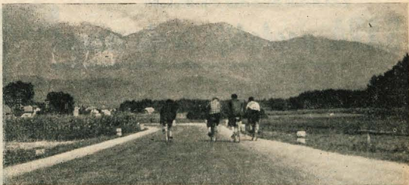
NA CESTI PROTI VISOKEM JE TAKALE VOŽNJA KOLE-SARJEV VSAKDANJI POJAV