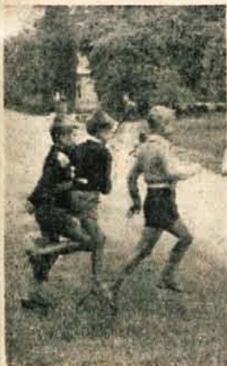
Na cesti smo iznenadili kopicco otrok...

Mnogi se pritožujejo, da se na naših cestah spričo naraščujočega prometa vse bolj uveljavlja zakon