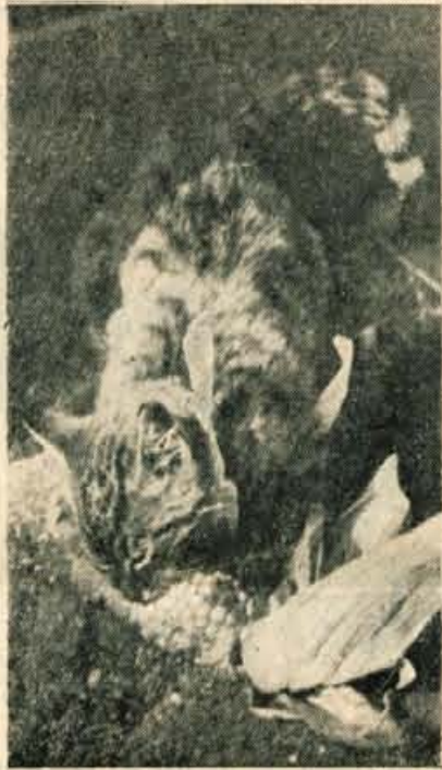
DOBER TEK, MUČKI

Mačka, ki bi s takim užitek kot tale na sliki jedel koruzo, verjetno še niste videli. Pa se vseeno najdejo tudi taki primerki. Mačke so sicer pretežno mesojede živali, vendar jim včasih tekne tudi kaj rastlinskega. Še nedozorelo, mlečno zrnje koruznega storža je tale mladič glodal s takim zadovoljstvom in tekom, da bi se mu pač vsakdo čudil. Motil se sploh ni pustil in če sem se mu približal, je samo zarenčal in me grdo pogledal. Kaj sem hotel? Za spomin sem ga fotografiral in mu voščil še dober tek.