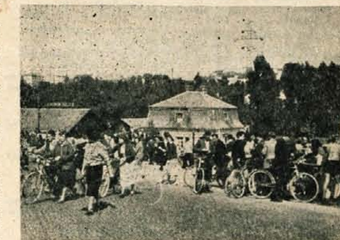
Tako je vsak dan ob 14. uri pod gašteljskim klancem, ko odhajajo Iskrani z dela

Komaj se je začelo novo šolsko leto, so se na območju Zdravstvenega doma Jesenice spet začeli specialni pregledi zob šolske mladine. Razen tega, da imajo ti preventivni ukrepi svoj praktični pomen, bodo hkrati pokazali tudi pomembnejše znanstvene rezultate, ker jih predvsem v ta namen