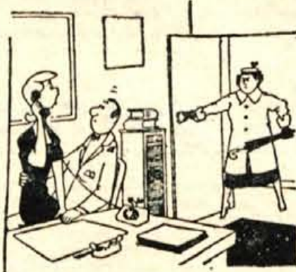
— Ne, šef vas jutri ne bo mogel sprejeti, ker ga bodo morali vsak čas odpeljati v bolnišnico!

Skorsaj — rok ni pobliže odrejen — bodo sovjetski znanstveniki spustili v vesoljstvo še tretji satelit. Tretji satelit bo z različno prejšnjih dveh znatno težji, vendar bo njegovo žvljenje znatno krajše, ker bo letel po vesolju, oddaljenem od zemlje le 500 do 800 km.