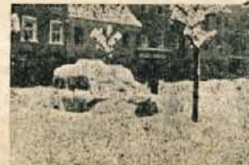
Avto v neprijetnem objemu belega »sovravnika«

potniki. Vozni red je ovrgla sila prirode. Avtobusi so prihajali in odhajali le, kadar in kakor so mo-