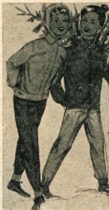
Za mlade smučarje in smučarke, ki jih je v počitnicah vendarle razveselil sneg.

Gube nastajajo zaradi staranja in zaradi pomanjkljive prehrane in nezadostne prekrvavitve kože. Preprečujemo in omilimo jih z zdravno prehrano (mnogo sadja); nadalje z izmeničnimi toplimi in hladnimi obraznimi kopelmi; s toplimi in mrzlimi obkladki; s kamilično sopro; z maskami za obraz, narejenimi iz kašaste zmesi pšenične, riževe ali ovsene moke ter mleka ali citronove kisline, kumaricnega soka ali kamiličnega čaja; kašasto zmes nanesemo na obraz, vendar pustimo oči in usta prosta; masko obdržimo nekaj časa na obrazu. Zatam namažemo kožo s hranljivo kremo.