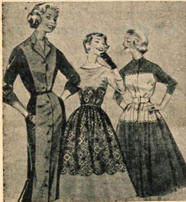
Tri različne kombinacije starega z novim. Kot vidite, je tudi obleka iz dveh tkanin lahko okusno napravljena. Njena prednost je v tem, da je poceni.