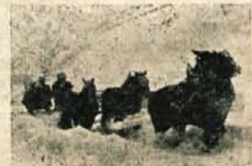
»Ker niste mogli drugače, je naša pomoč dobrodošla,« bi opravičeno dejali konji

S čiščenjem cest, zlasti glavnih, so začeli že rano jutraj. Uprava za ceste v Kranju je že ob štirih jutraj razposlala več motornih plugov v razne smeri, da bi preorali ceste. Pa tudi po drugih krajih so se z vsemi silami uprli snežni ofenzivi. Skupine železničarjev so že ponoči, kmalu ko je začelo snežiti, odpotovale v razne smeri in sproti čistile kretnice in druge objekte, da bi preprečili zastoj.