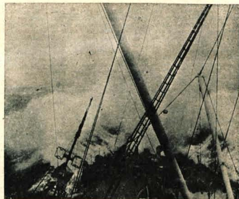
Ladja »Monarch« se je večkrat borila z velikimi valovi oceana, ki so jih povzročile nenadne nevihte

Britanska ladja za polaganje kablov »Monarch«, največja ladja te vrste, je položila kabel po vsej dolžini v sedmih mesecih. Polaganje kabla v morske globine pa je bilo možno le v poletnih mesecih, ko so vremenske prilike na Severnem Atlantiku najboljše. Ker ta kabel, ki so ga uporabili za novo telefonsko zvezo, prenaša signale samo v eno smer, je bilo potrebno postaviti dva kabla, da je omogočen normalen telefonski razgovor. Zato je ladja »Monarch« prvi kabel od Clarenvillea do Obana položila od junija do septembra 1955. leta, drugega pa v času med julijem in avgustom 1956. leta. Kabla ležita v globinah Atlantskega oceana drug od drugega v razdalji 64 km.