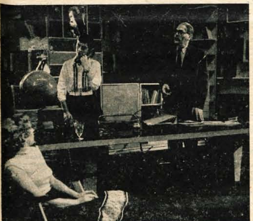
Prizor iz igre argentinskega dramatika Alejandra Casone »Drevesa umirajo stoje«. — S tem delom se je Slovensko ljudsko gledališče iz Celja nameravalo predstaviti včeraj (četrtak, 23. januarja) kranjskemu gledališkemu občinstvu v Prešernovem gledališču. Zaradi vremenskih neprilic in pa zaradi boleznij v ansamblu, je bil, žal, obisk celjskih gledališnikov v Kranju preložen na poznejši čas.

Gostovanje celjskih gledališnikov preloženo