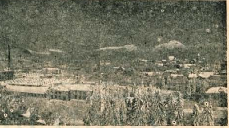
Pod belo odejo, čeprav ni pokrila tovarniških dimnikov, pride še bolj do izraza, da je Kranj s svojo okolico tudi turistično in ne le industrijsko središče.