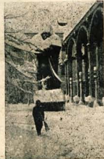
Tudi Prešeren je dobil to zimo nov plašč

Prve in tudi glavne težave so nastale v prometu. Vlaki so prihajali na železniško postajo v Kranj z velikimi zamudami. Balkan Express iz Avstrije je imel več kot dve uri zamude. Na avtobusni postaji so čakali nervozni