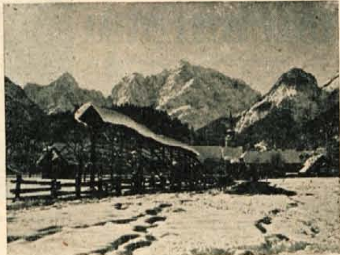
Kranjska gora v snegu