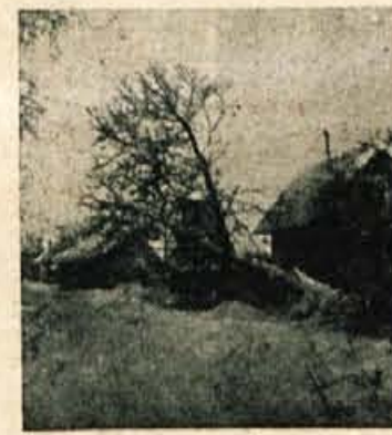
Pod težo snega se je lomilo drevje

Tokrat zapadli sneg je bil prva letošnja preizkušnja za naš promet. Posebno velikih zastojev pa le ni povzročil. Res da so delavci prihajali v tovarne z znatnimi zamudami, toda že prvi dan so bile ceste v tolikšni meri očiščene, da poslej s te plati ne bo več posebnih težav. Precejšnje breme pa je