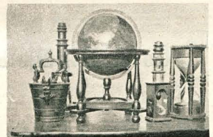
Nekaj predmetov iz zbirke na sliki so tudi globus in mikroskop

Ali je bilo res tako ali ne, zgodovina ne pripoveduje, pač pa je ohranila vrsto dokumentov, ki dopuščajo tudi to možnost.