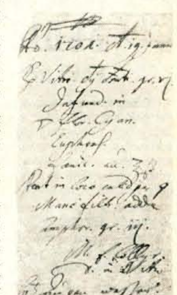
Najstarejši ohranjeni zdravniški recept, z datumom 19. 1. 1701, je tudi v zbirki farmacije v Tržiču