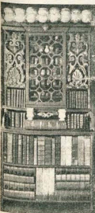
V srednjem delu omare je znamenita lekarniška omarica

celnik. V sosednjem prostoru je objokana vsa družina, ki že nekaj ur moli... Toda niti zdravnik niti molitve in jok niso pomagali.