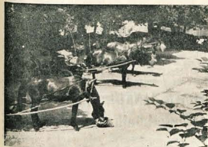
Za turiste so kočijaži na Bledu dokajšnja zanimivost. Kako tudi ne, saj jih velika mesta skoraj ne premorejo več.

Razen Belgijcev se tudi Svicarji močno zanimajo za turistične privlačnosti Gorenjske. V letošnji sezoni sta obiskali Gorenjsko kar dve filmski skupini iz Švice, in sicer ekipa Radio-televizije in ekipa lovške zveze.