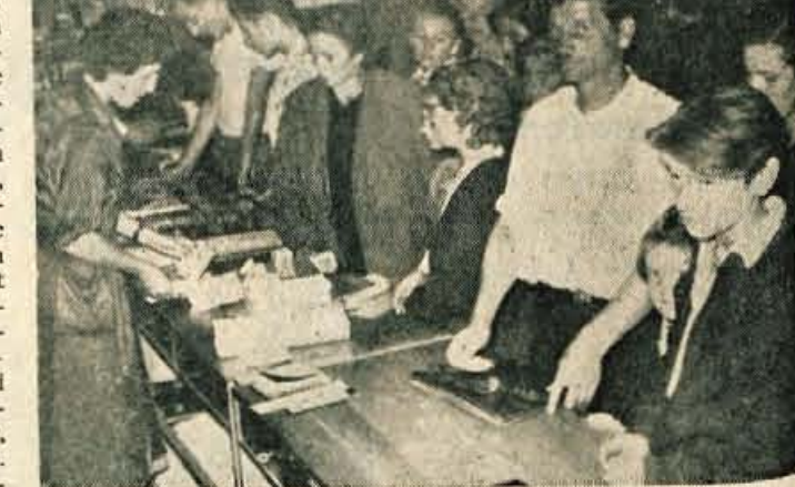
Knjižgarna »Simon Jenko« v Kranju je bila zadnje dni nabito polna. Začela se je šola, vendar so številni zamen čakali, da bi lahko svojim otrokom kupili potrebne šolske knjige.

V ponedeljek, 8. t. m. ob 19.30 uri bo v kinodvorani na Dovjem zanimivo zdravstveno predavanje o TBC in pljučnjem raku. Dosle so bila podobna predavanja dokaj dobro obiskana. Tokrat pa bo zdravnik - specialist z Golnika svoja izvajanja ilustriral s slikami. Na ta način se bodo poslušalci z nevarnimi boleznima temeljiteje seznanili.