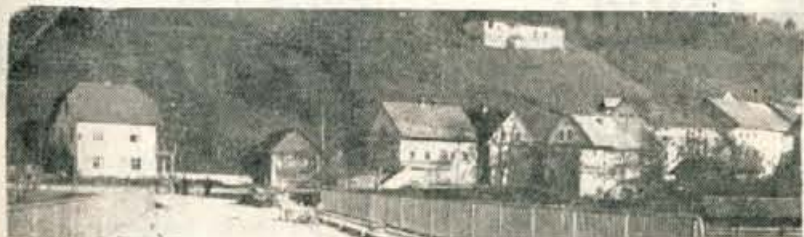
IZ PERSPEKTIVNEGA PLANA ObLO GORENJA VAS V Gorenji vasi — kmetijstvo v ospredju — str. 3