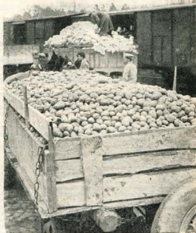
TUDI KROMPIRJA LETOS NE BO MANJKALO Prvi pridelek za potrošnike izven okraja