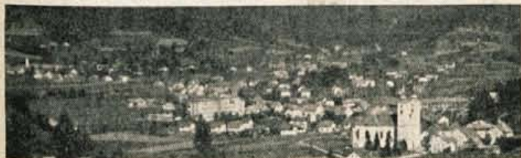
O PERSPEKTIVNEM RAZVOJU ZIROVSKE OBČINE — str. 5