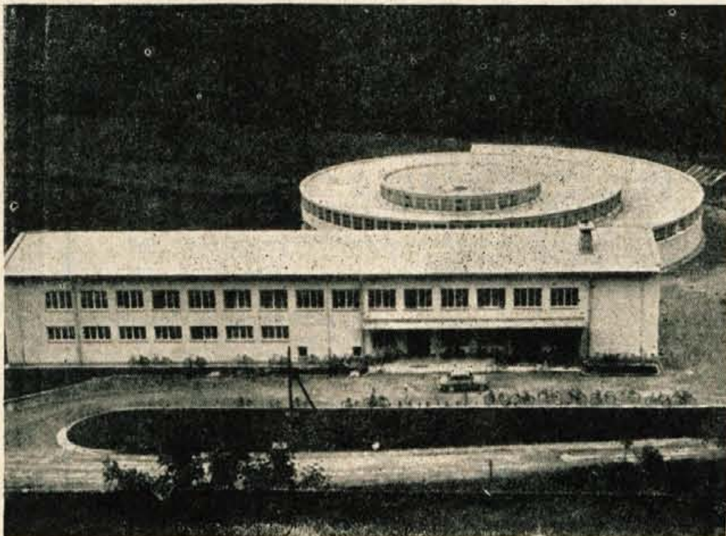
Nova arena? Ne, marveč novo obratno in upravno poslopje industrijskega podjetja NIKO iz Železnikov. V novih prostorih že poizkusno obratujejo, slavnostna otvoritev novih prostorov pa bo za občinski praznik, 9. januarja 1959. leta.