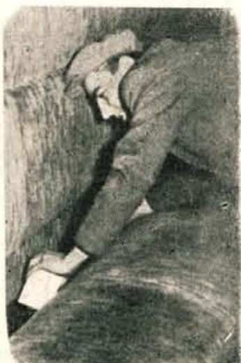
Tihotapčevno skrivališče blaga v kupeju

Podoba je ista: kopica potnikov in prtljage.