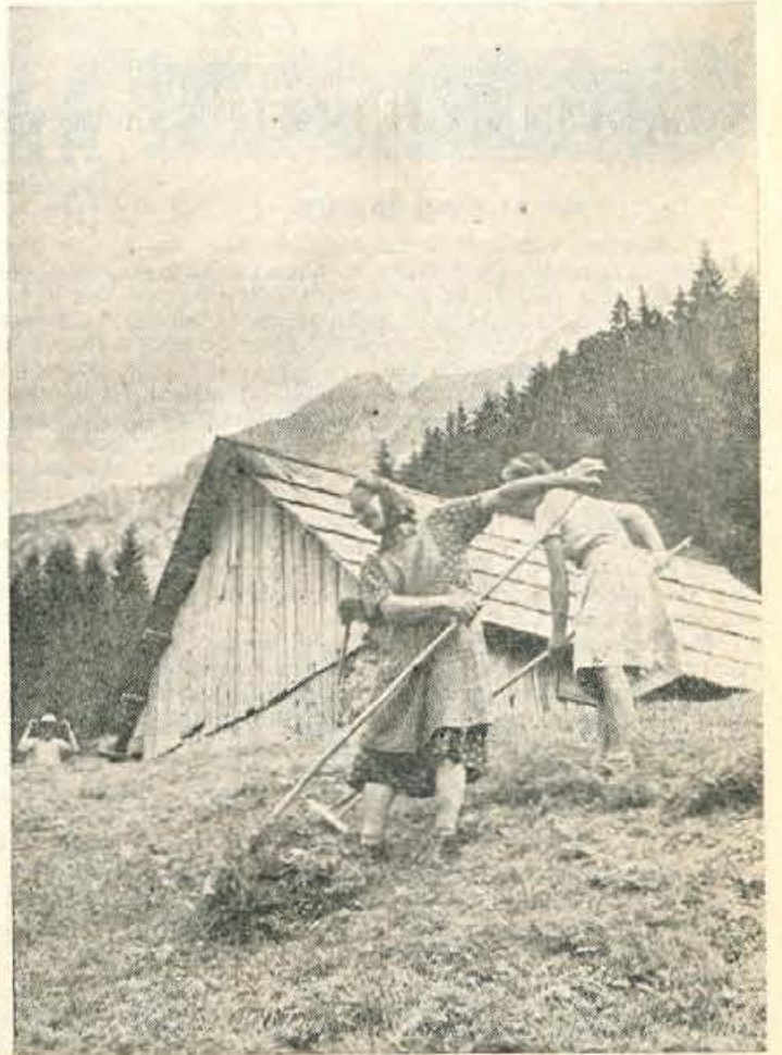
PO TRAVNATIH REBRUH POD STORŽIČEM, KJER SO NEKODI POKALE PARTIZANSKE PUSKE, JE MIRNO; LE OD POBOČIJ ODMEVATA PESEM IN SMEH MARLJIVIH LJUDI