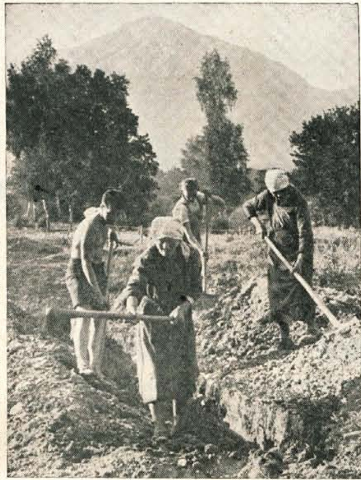
MLADI IN STARI — VSI SO SE SLOŽNO LOTILI DELA, ZAVEDAJOČ SE, DA GRE ZA NJIHOVO DOBRO

Na Gorenjskem je še precej vodo iz vodnjakov. Seveda so to le tisti, ki mislijo, da se vse lahko čez noč naredi. Nekateri želje pa je moč uresničiti le s