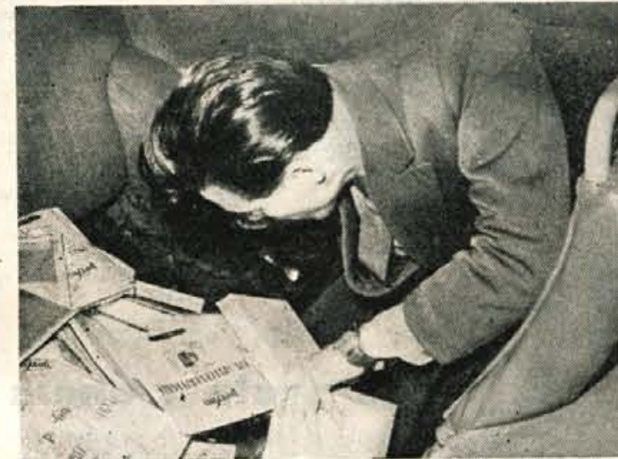
Perlon nogavice pod sedežem osebnega avtomobila

bencev carinarnice. — »Zaradi sumljivih okoliščin sem se poslužil v nekem kupeju ponovne, to pot temeljite kontrole. Seveda so potniki ogorčeno protestirali, češ da so že bili pregledani. Protesti niso mnogo zalegli. Prtljaga je romala s polic. Pregledoval sem kovček za kovčkom. Nič posebnega nisem našel. Prepričan sem bil, da je dvojna kontrola, ki se je že šestokrat izkazala kot zelo učinkovita delovna metoda, to-