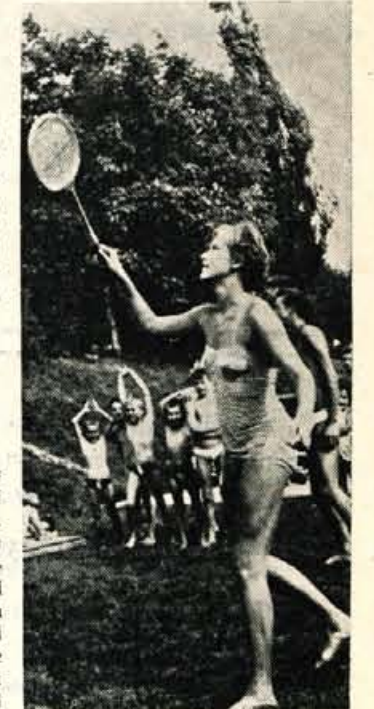
Badminton si utira pot med našo mladino

PK »Triglav« je že začel s prvim tečajem plavalne šole, ki bo trajal do konca tega meseca. Otroci, ki jih je tudi letos zelo veliko, so razdeljeni v več skupin. Otroci, ki se uče plavati pod nadzorstvom članov plavalnega kluba, dobivajo vsak dan tudi izdatno malico. Če bo vreme še naprej tako ugodno, se bo tudi letos lahko vsak tečajnik naučil plavati. Prihodnji tečaj pa se bo začel 1. avgusta.