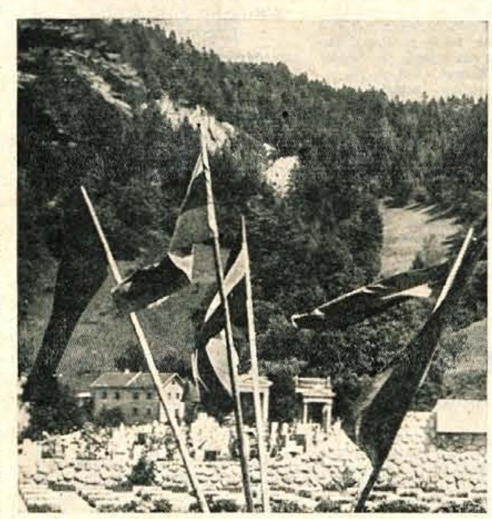
Zastave nad grobovi nas spominjajo oporoke padlih za svobodo

Ze v začetku proslav so preteklo soboto zvečer na Ravnah, tam 'jer se Tržič razteguje po dolini proti Ljubelju, odprli veliko hišo s trgovinskimi bloki v