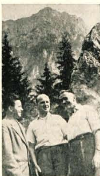
Preživeli borci — ustanovitelji Tržiško-kranjske čete so se srečali

Pripovedovanje Planina, je nadaljeval tovariš Uzar: »Poslej smo imeli