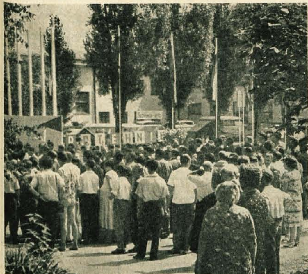
Ze ob otvoritvi je bilo letos za 8. gorenjski sejem veliko zanimanje

V počastitev občinskega praznika in v okviru prireditev 8. gorenjskega sejma, se je po daljšem času Kranjčanom spet predstavil s samostojnim koncertom pevski zbor obrtniškega društva »Enakost« iz Kranja, ki je bil v petek zvečer. Pester spored pa je izpopolnil tudi kvintet »Kranjčani«. Zbor je pod vodstvom Viktor-