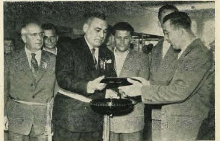
Takoj po otvoritvi 8. gorenjskega sejma, sta si predsednika občin La Clotat (Francija) in Kranja s svojim spremstvom z zanimanjem ogledala razstavljene predmete, zlasti s področja ročnih del

Tudi v prihodnjih dnevih bodo sejem obiskali prebivalci z vseh