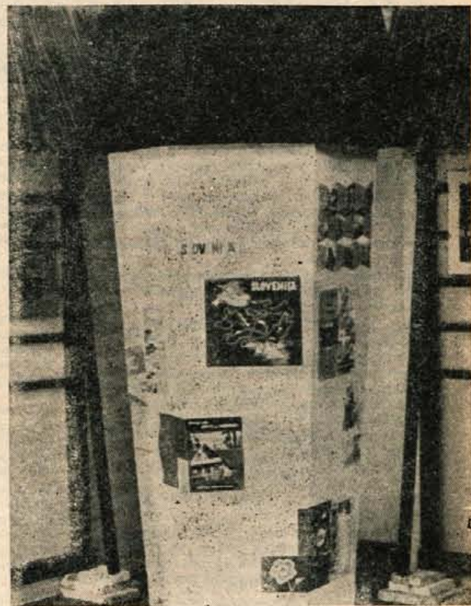
Turizmu bo letos posvečen največji del 8. gorenjskega sejma

P rvega avgusta se bodo v počasi prilagaja. Vzroki so različni. Včasih subjektivnega, večsah objektivnega značaja. Naj navedemo samo primer: kolektiv «Mehanotehnika» iz Izole je mišljenja, da naši trgovci podcenjujejo domače igračke. Zato so na sejmu pripeljali veliko izbiro igračk. Podjetje bo neposredno, brez trgovine, prišlo v stik s kupci in jim nudilo izdelke.