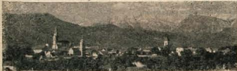
OB PRAZNIKU OBČINE KRANJ — str. 7