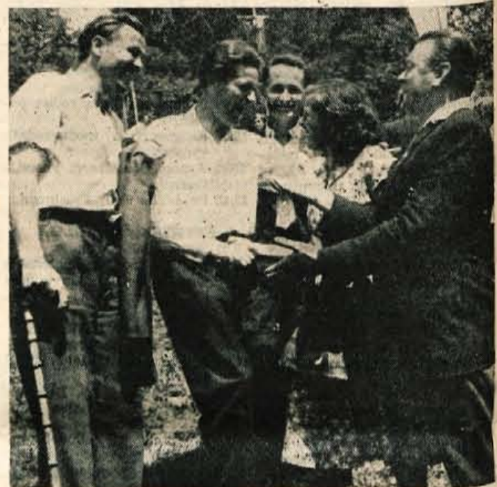
Udeleženci ustanovitve Prešernove brigade v Davči pred 15. leti so si krepko stisnili roke.

ko je bil; suhljat, žilav, pa prijazen — prava »korenina«. Takih je bilo veliko. Bile so ženske z odlikovanji, možaki, ki so izgubili v NOB svoje, vdove in matere padlih; tu so bili tudi sinovi herojev. Med pionirji, ki so radovedno strmeli v visoko tribuno, je bil tudi svetloas, suhljat fant. Njegov oče je padel kot Prešer-