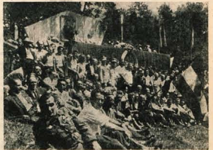
Več kot 350 preživelih borcev Prešernove brigade se je včeraj zbralo na proslavi 15. obletnice ustanovitve te enote, kot kaže naša slika. Srečanje borcev je bilo prisrčno, ganljivo.