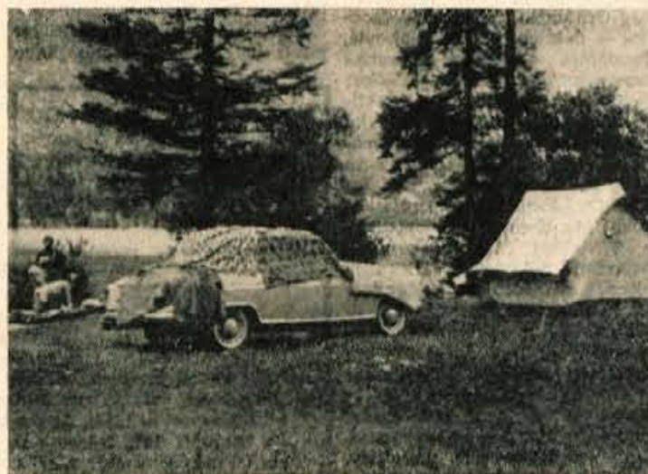
Tudi ob Bohinjskem jezeru je nešteto domačih in tujih turistov.

Točno ob napovedanem času, to je ob 8. uri, je startalo prvih pet. Zal pa je imel eden od teh smolo; po nekaj zamahih se mu je zlomilo veslo in že se je znašel v vodi poleg obrnjene čolna. Vsakih 15 minut je startala nova skupina tekmovalcev. Gledalci, ki se jih je precej zbralo ob cilju, so vozače navdušeno bodrili. So bolj vztrajni in glasni pa so bili navijači v Grajskem kopališču.