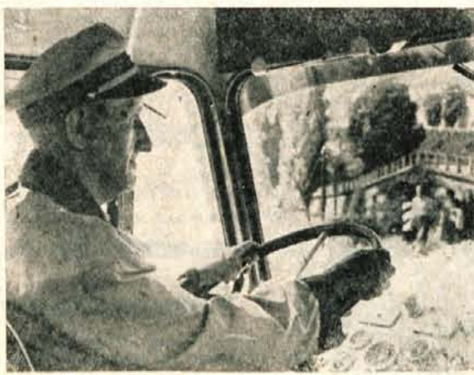
Jo vsej Gorenjski so Dan šoferjev lepo praznovali