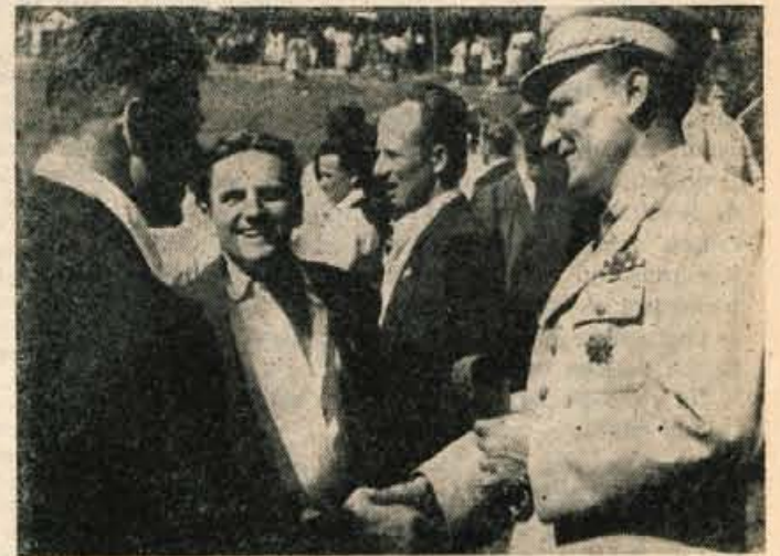
Tudi general major Rudolf Hribnik - Svarun je med borci obujal spomine na mnoge borbe, ki jih je vodil po Selški in Poljanski dolini, po Gorenjskem in po Slovenskem Primorju.