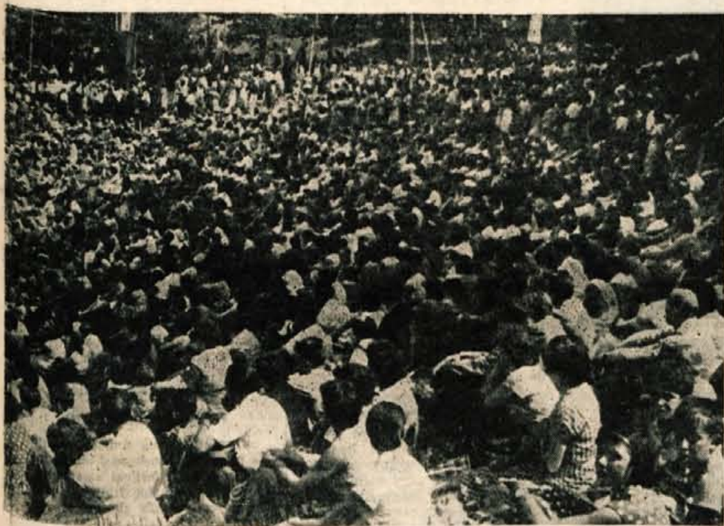
Da spomini na dneve NOV niso pozabljeni, je pokazala tudi včerajšnja množična manifestacija.

Na to proslavo so se skupno s Prešernovci pripravljali tudi aktivisti, interniranci — skratka vsi, ki so sodelovali v narodnoosvobodilnem gibanju.