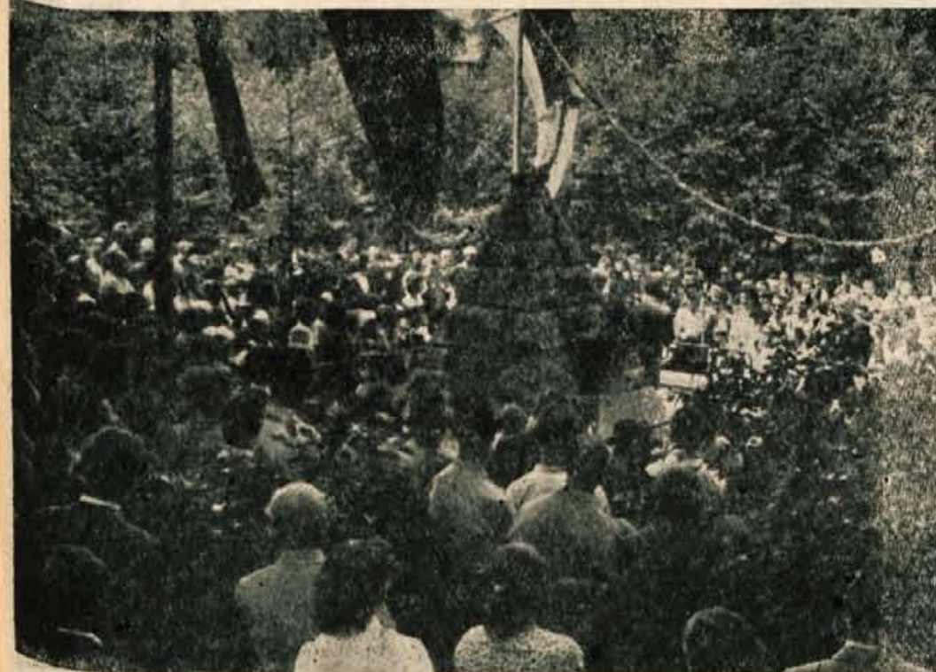
Veličastne proslave v Strahinju so se Gorenjci udeležili v velikem številu