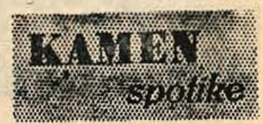
SREDI MESTA — SMETIŠČE

Kranjski okraj je po številu darovalcev krvi na 3. mestu v Sloveniji