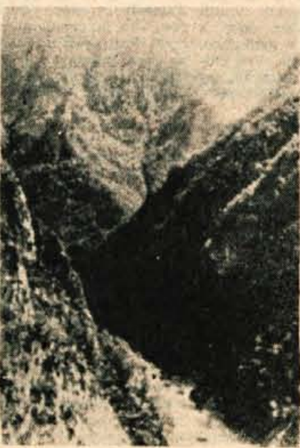
Kanjon reke Pive v bližini vasi Martinj

Sutjeska je ozka reka, široka vsega 10 metrov. V maju in juniju najbolj