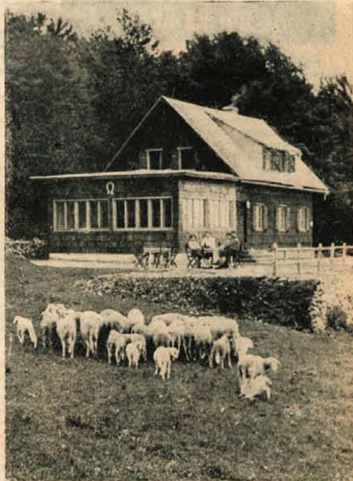
Planinsko društvo Križe je letos povečalo kočjo na Kriški gori z verando.