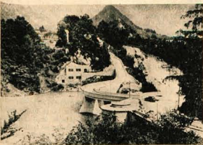
Hidroelektrarno Moste obiskuje te dni tudi mnogo šolskih otrok iz vseh krajev Slovenije