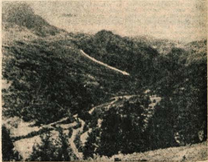
Pogled na dolino Sutjeske pri Tjentištu. V ozadju sta Maglič in Volujka, puščica pa kaže, kje so nosili ranjence preko Sutjeske

V teh krajih na področju sedanjega Gorazdanskega okraja je bilo torej formiranih vseh pet prvih proletarskih brigad NOV Jugoslavije.