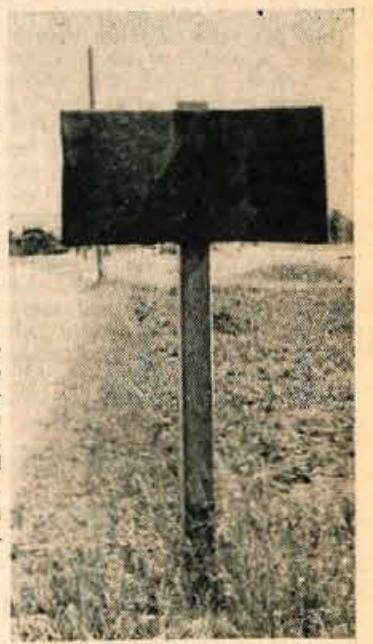
REBUS ALI NAPIS

Rebusi spadajo v ugankarske količke, prav gotovo pa ne na napisne table, ki naj označujejo imena krajev. Tujec, ki potuje z Jesenic in je namenjen v Lesce, bo zaradi napisne table, ki naj bi označevala ta kraj in ki jo vidite na sliki, prav gotovo zgrešil Lesce. Če že drugega ne, takšen napis kaže na malomarnost in mimoidečim ne more delati dobrega vtisa.